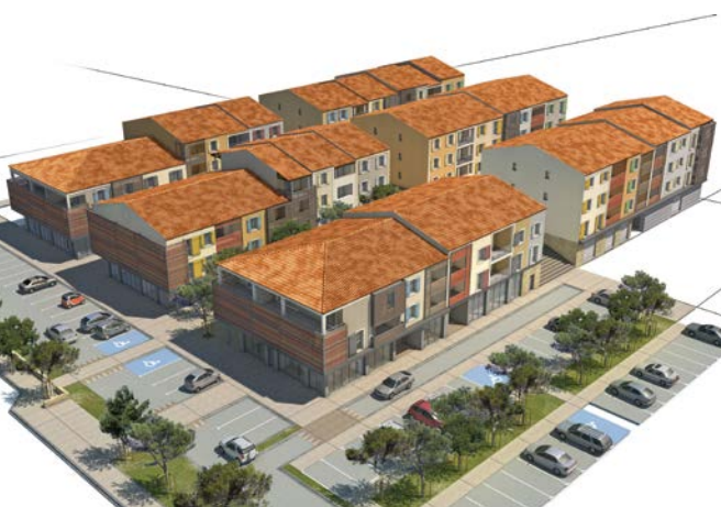
Vue de la résidence

Enduits pastels, volets colorés... l'architecture est résolument méditerranéenne et le style soigné. Il en est de même pour les prestations intérieures ; l'agencement des appartements a été conçu pour répondre aux attentes des locataires : cuisine équipée de meubles au goût du jour et de tout l'électroménager nécessaire, salle de bains avec sèche serviette, placards aménagés dans les chambres, agréable terrasse. La résidence est fermée et dispose de parkings en sous-sol voire de garages pour les T4. Autant de prestations qui garantissent un placement locatif sûr.