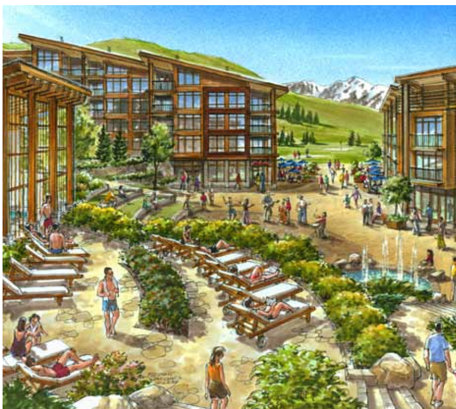
LA MONTAGNE EN ÉTÉ : UNE SOURCE DE BONHEUR RAFRAÎCHISSANTE

RENDU ARTISTIQUE DU CONCEPT - PLANS, PHOTOS ET ILLUSTRATIONS NON CONTRACTUELLES