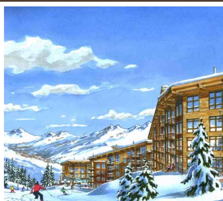
EDENARC 1800 : VUE D'ARTISTE

L'architecture d'Edenarc 1800 fait preuve d'un raffinement sans retenue. De vastes baies s'ouvrent sur le majestueux paysage extérieur. Des lignes pures et contemporaines se marient avec un naturel parfait aux détails nobles évocateurs du riche passé de la Maison de Savoie.