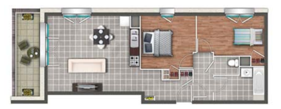
EXEMPLE D'AMÉNAGEMENT : APPARTEMENT T3

Tous les appartements ont été étudiés pour vous offrir un juste équilibre entre confort de vie et fonctionnalité. Les logements, du T2 au T5, disposent d'un parking, d'un balcon-loggia ou de larges terrasses pour les derniers étages. Des prestations élégantes et de qualité : cuisine intégrée, parquet dans les chambres, placards aménagés, volets roulants électriques. La résidence respecte le niveau de performance exigé par le label BBC-EFFINERGIE®, ce qui vous assurera un grand confort et de précieuses économies d'énergie.