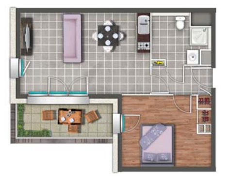
EXEMPLE D'AMÉNAGEMENT : APPARTEMENT T2

Tous les appartements ont été étudiés pour vous offrir un juste équilibre entre confort de vie et fonctionnalité. Les logements, du T2 au T5, disposent d'un parking, d'un balcon-loggia ou de larges terrasses pour les derniers étages. Des prestations élégantes et de qualité : cuisine intégrée, parquet dans les chambres, placards aménagés, volets roulants électriques. La résidence respecte le niveau de performance exigé par le label BBC-EFFINERGIE®, ce qui vous assurera un grand confort et de précieuses économies d'énergie.