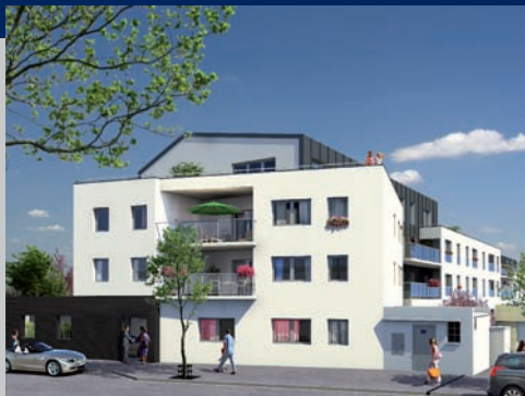
Façade sur la rue Auphelle.