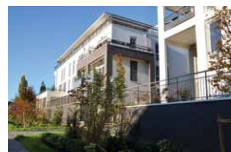
Les premiers immeubles livrés donnent vie au quartier