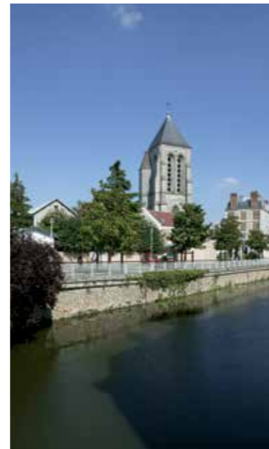
Berges de l'Esnonne

Théâtre, conservatoire, médiathèque, base nautique... Corbeil-Essonnes dispose de nombreux lieux d'expression culturelle et de toutes les infrastructures nécessaires au quotidien. Les espaces verts sont également privilégiés, avec notamment les belles promenades sur les berges de la Seine et de l'Esnonne.