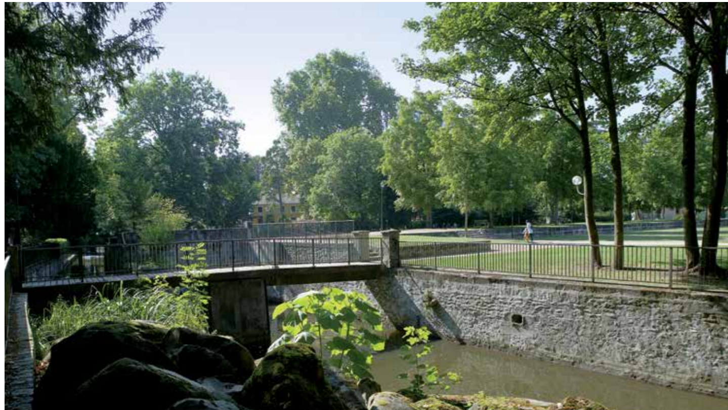
Parc de Chantemerle