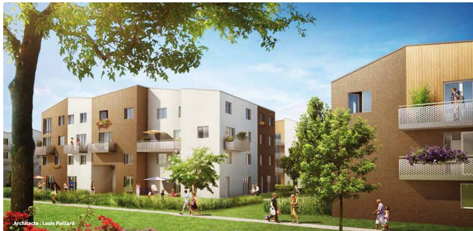
Architecte : Louis Paillard