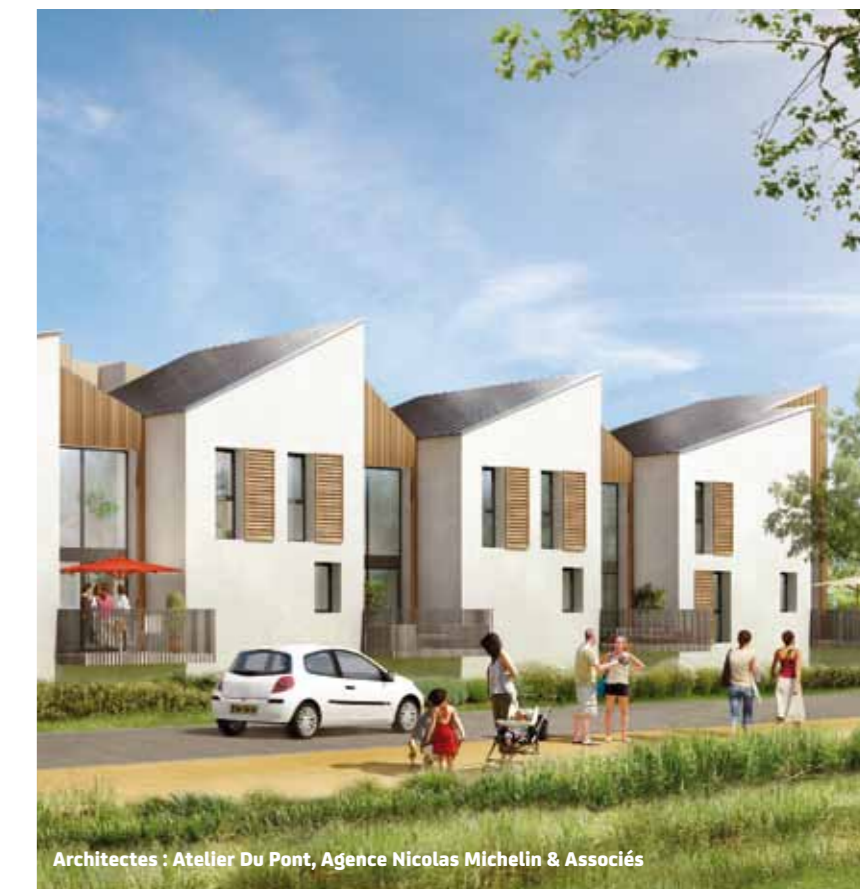
Architectes : Atelier Du Pont, Agence Nicolas Michelin & Associés