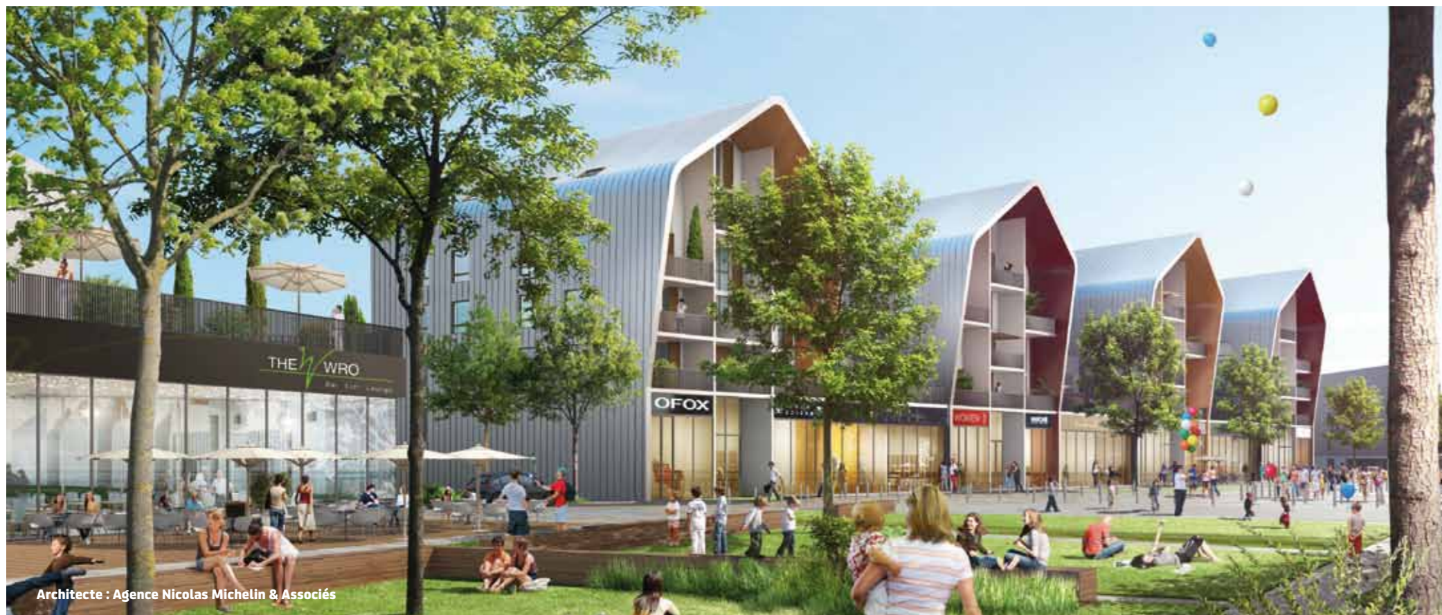
Architecte : Agence Nicolas Michelin & Associés