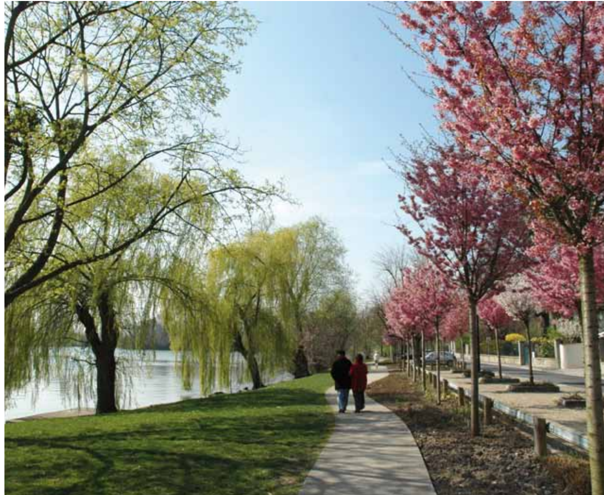
Promenade des quais de Seine