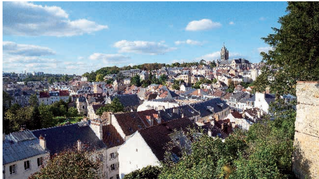
Pontoise depuis le Château

À 30 km** de Paris, la 2 ème ville de la Communauté d'agglomération de Cergy-Pontoise développe son esprit d'entreprise, aux portes du Parc naturel régional du Vexin français. Cette situation stratégique lui a permis de se doter de toutes les infrastructures indispensables au bien-être de ses habitants, que ce soit en termes de scolarité, de soins, de transports, de sports et de loisirs.