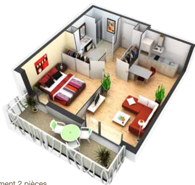
Exemple d'appartement 2 pièces

Le saviez-vous ? Votre bien peut être loué à vos ascendants. Il vous est également possible d'occuper personnellement votre logement et ainsi de vous constituer un patrimoine librement transmissible à vos enfants.