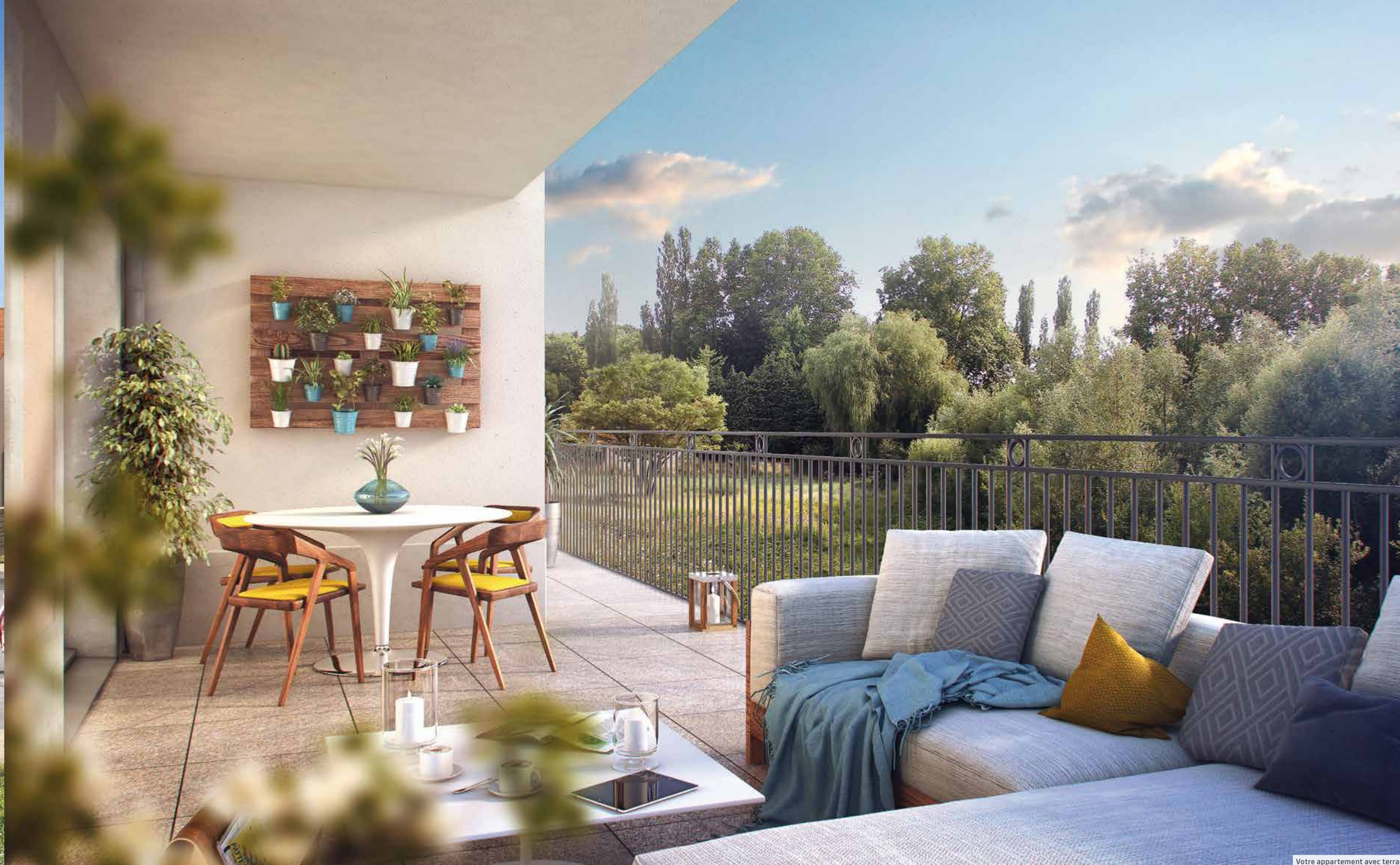
Votre appartement avec terrasse