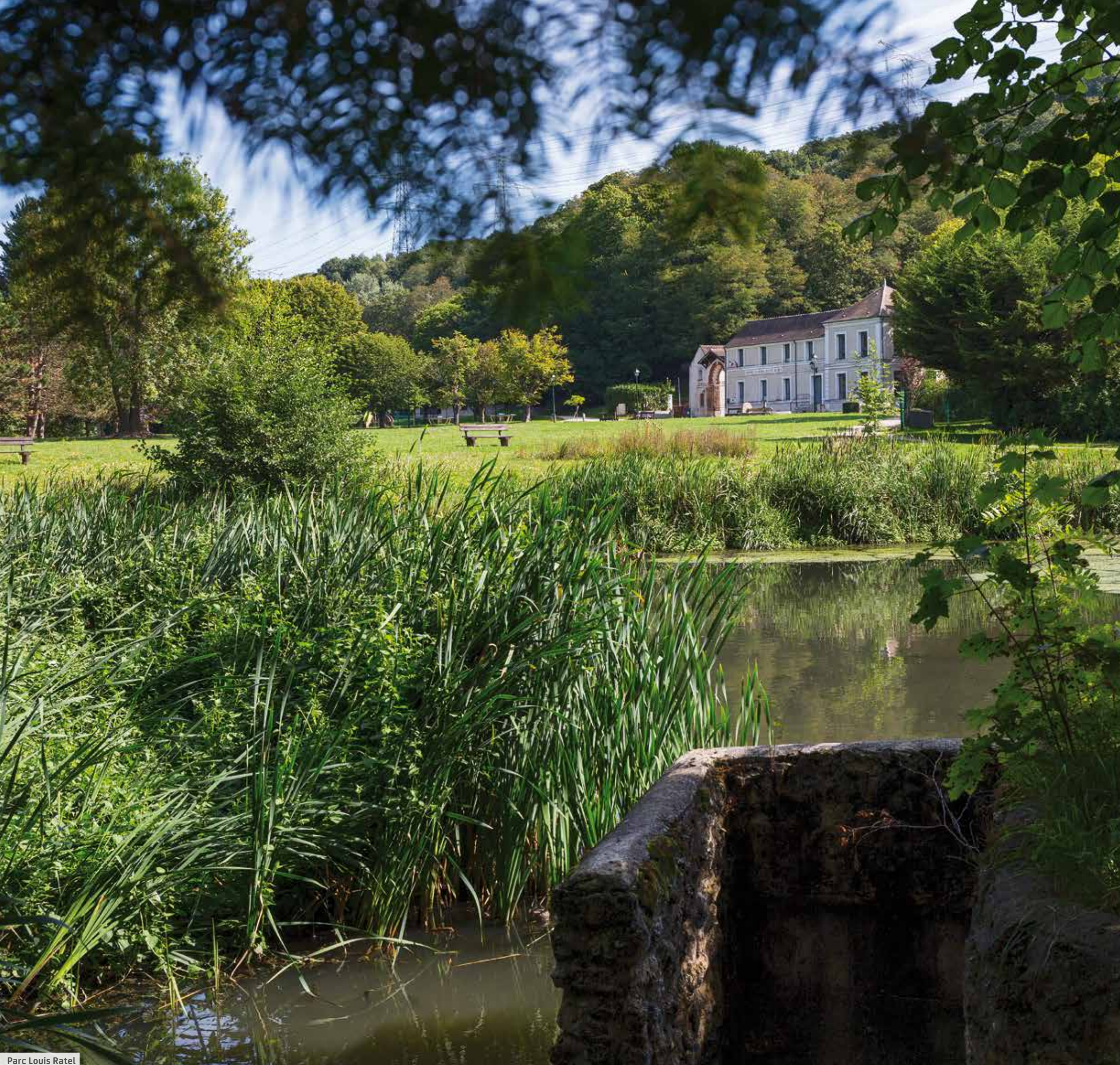
Parc Louis Ratel