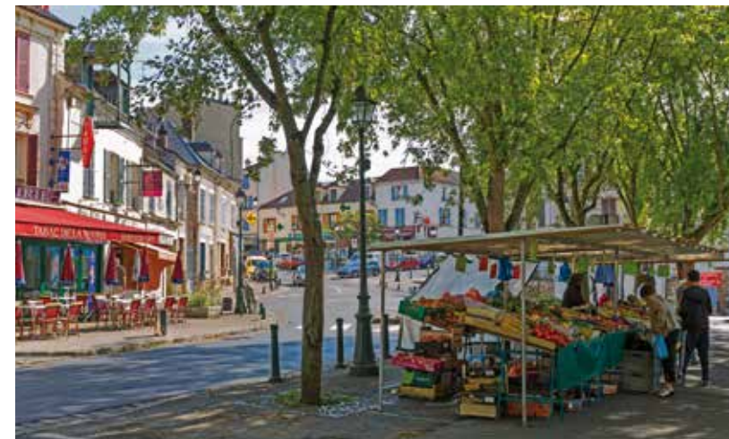
Ses commerces de proximité