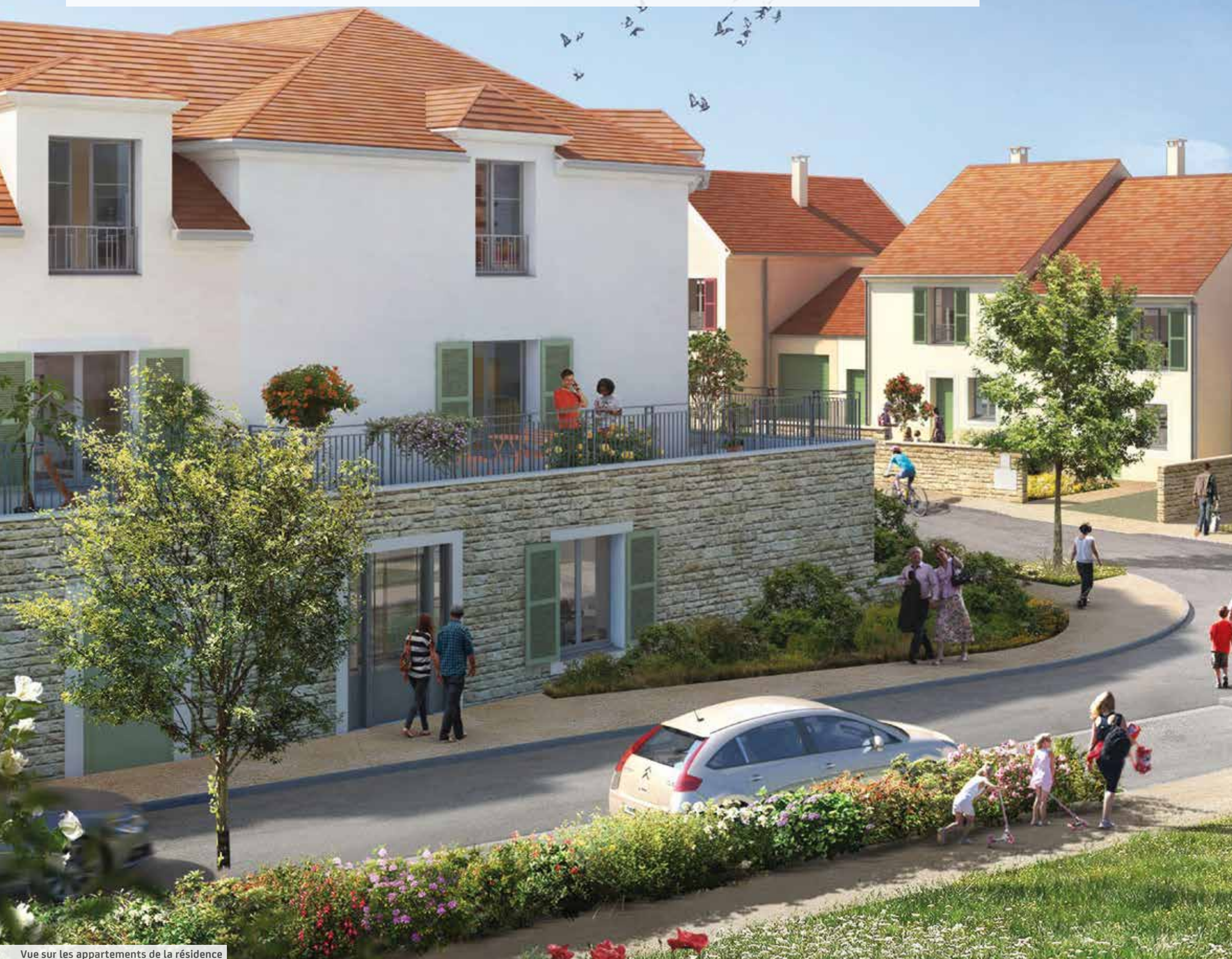
Vue sur les appartements de la résidence

Dans le respect de l'architecture locale, les bâtiments à taille humaine s'habillent d'enduit aux teintes naturelles et de parement en Pierre de tons clairs , conférant une douceur à l'ensemble du domaine. Jouant sur les volumes et les retraits, les façades s'animent, au gré des variations, de balcons ou terrasses coiffées par des lucarnes en fronton. Tout en finesse, les façades de nos maisons revisitent les codes traditionnels en utilisant des matériaux de qualité tels que la tuile en terre cuite des toits à pente douce.