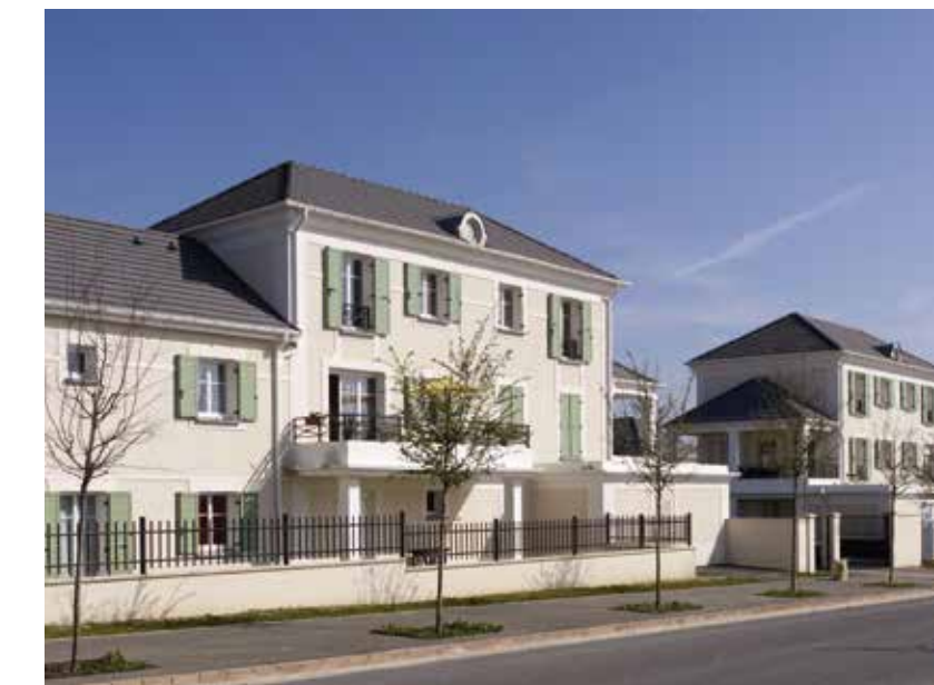
Magny-le-Hongre "VILLA MAGNY"