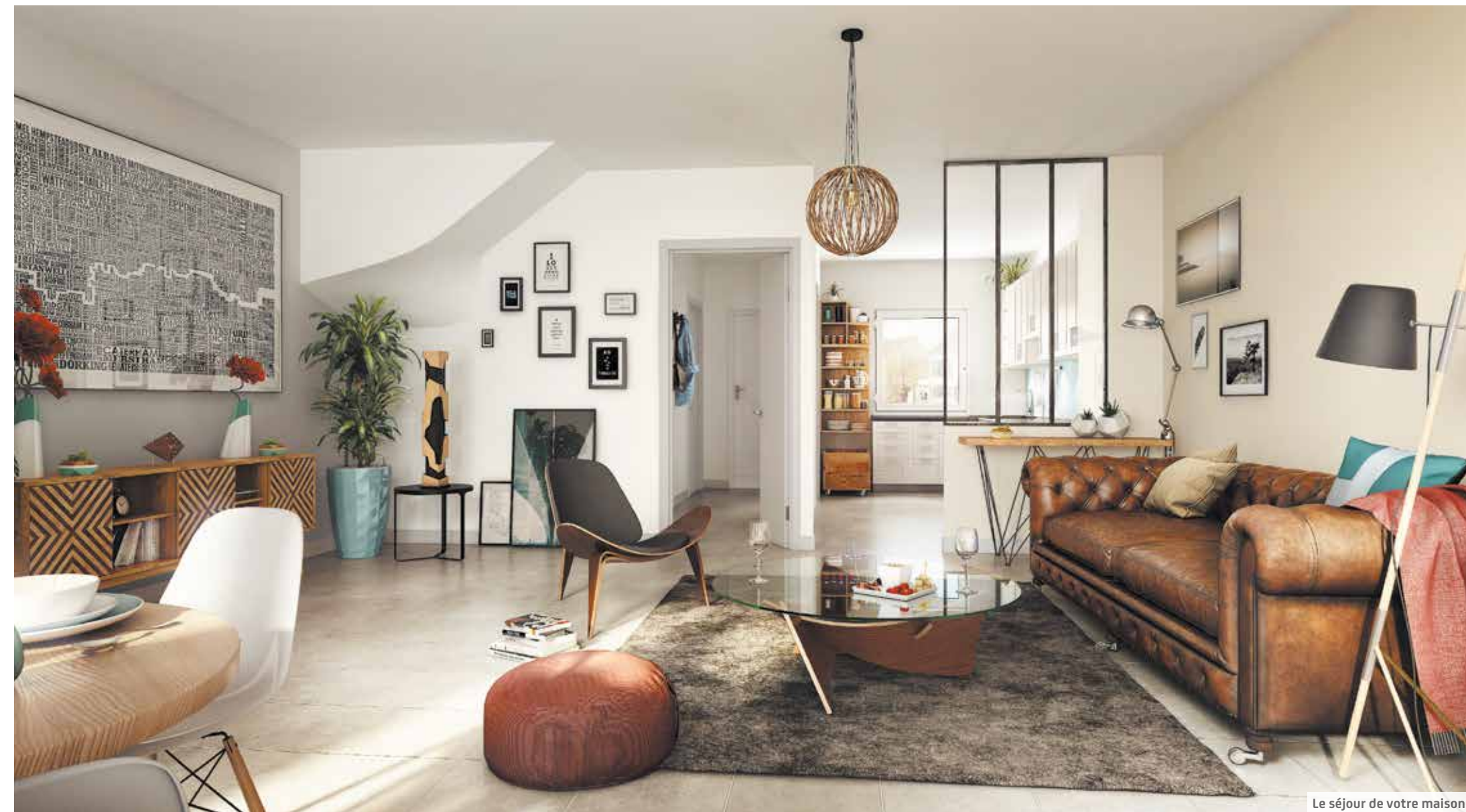
Le séjour de votre maison