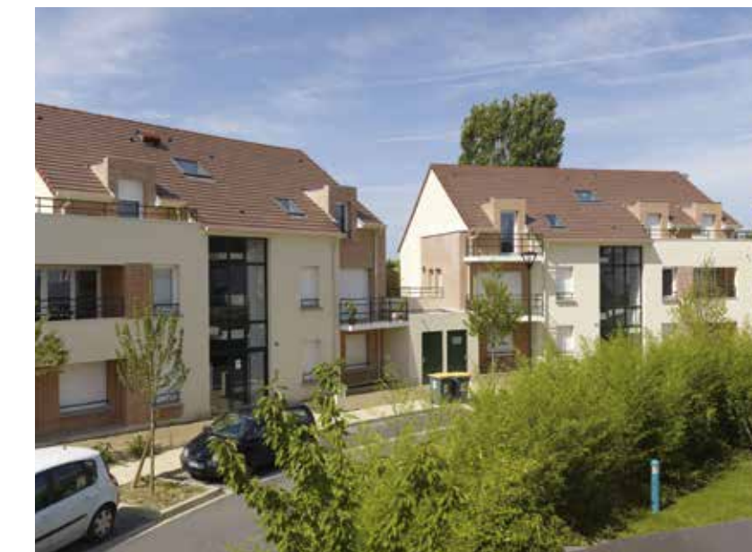
Gif-sur-Yvette "LES ALLÉES DU BOIS CARRÉ"