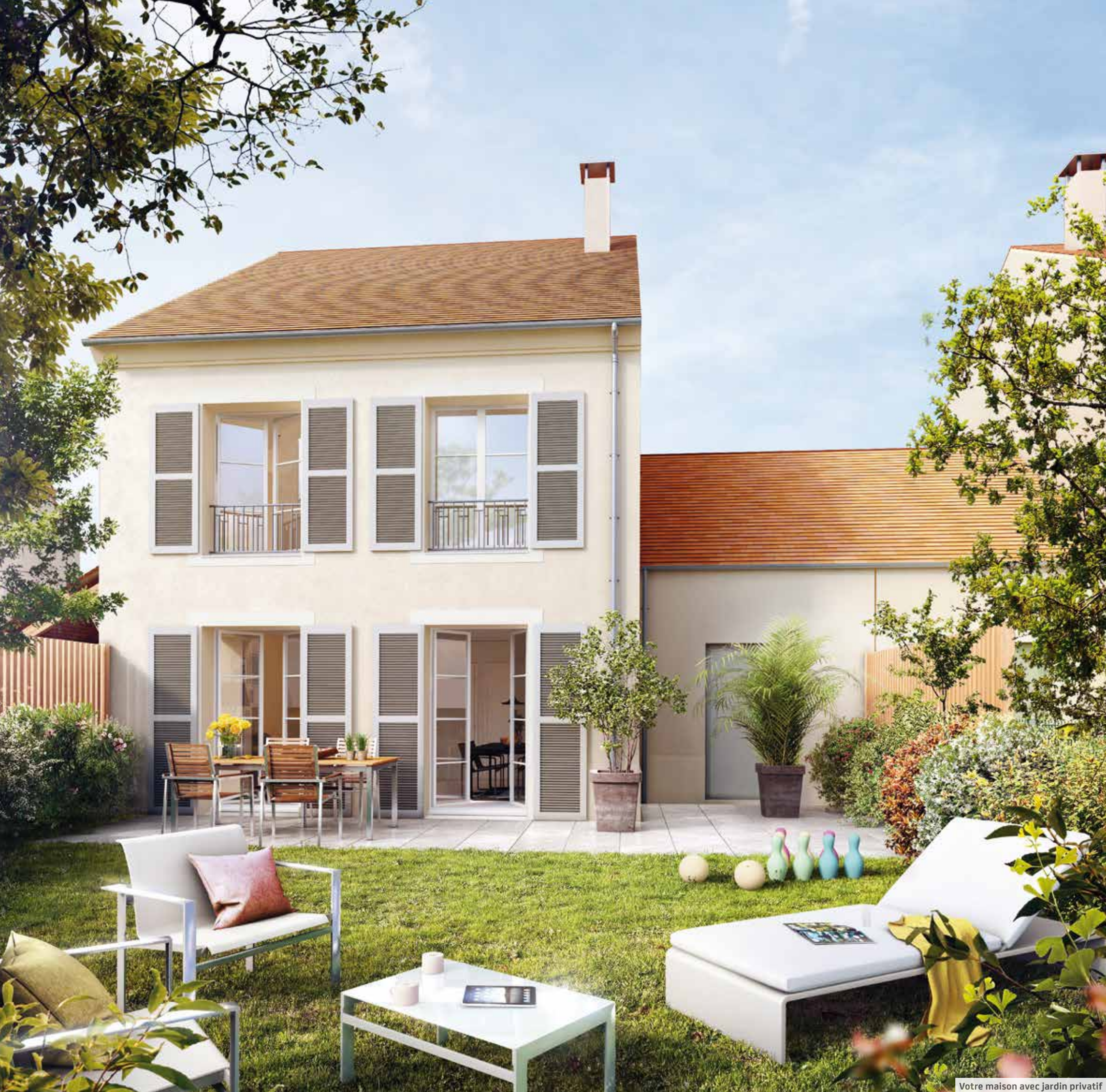
Votre maison avec jardin privatif