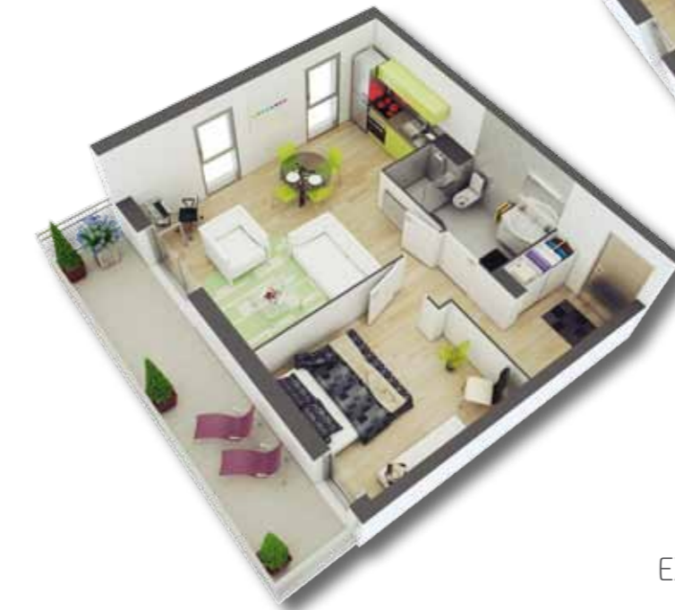
EXEMPLE DE 4 PIÈCES