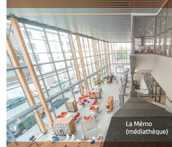
La Mémé (médiathèque)