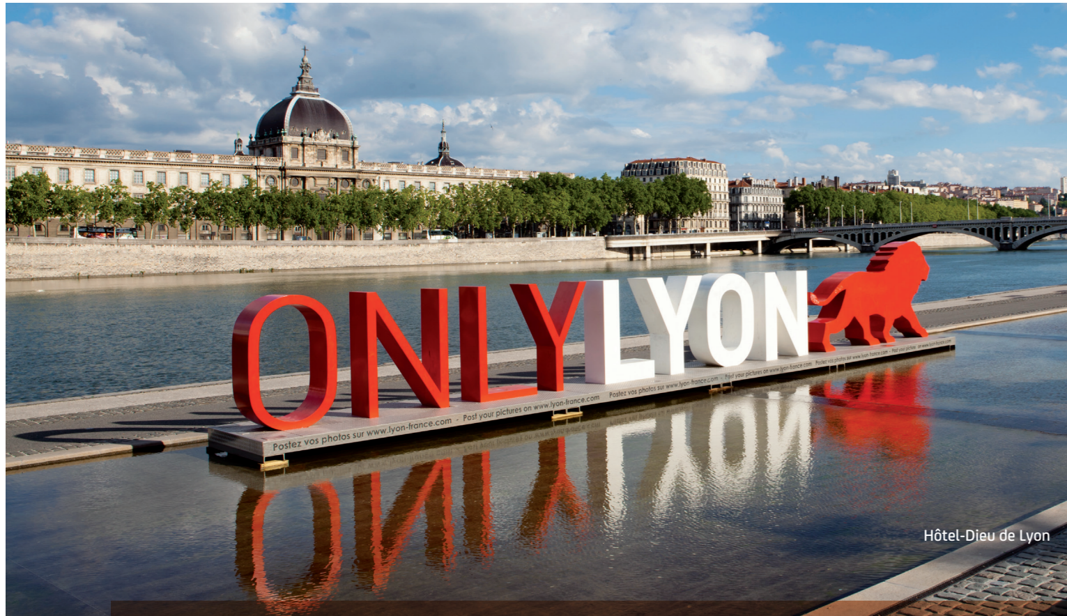
Hôtel-Dieu de Lyon

VOTRE FUTUR ENVIRONNEMENT : UN TERRITOIRE MODERNE ET INNOVANT !