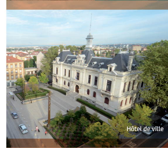
Hôtel de ville

NOS ARCHITECTES D'INTÉRIEUR, DÉCORATEURS ET PAYSAGISTES ONT APPORTÉ UN SOIN PARTICULIER À L'AMÉNAGEMENT DES ESPACES COMMUNS DE CETTE RÉSIDENCE*. TOUT EST PENSÉ POUR VOUS OFFRIR DES PRESTATIONS ET DES FINITIONS DE GRANDE QUALITÉ ET FAIRE DE CETTE RÉSIDENCE UN PRIVILÈGE.