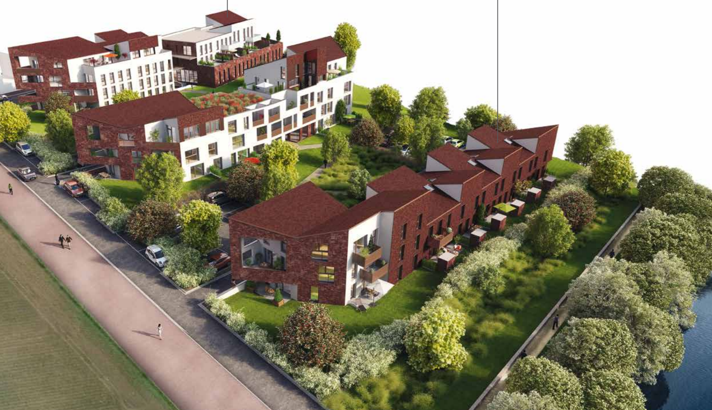
LES VILLAS DUPLEX