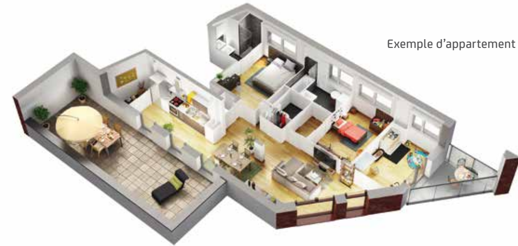
Exemple d'appartement 4 pièces