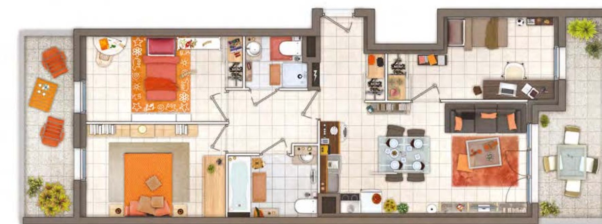
Exemple d'aménagement d'un 4 pièces

Conforme à la RT2012, votre logement limite les dépenses énergétiques et financières !