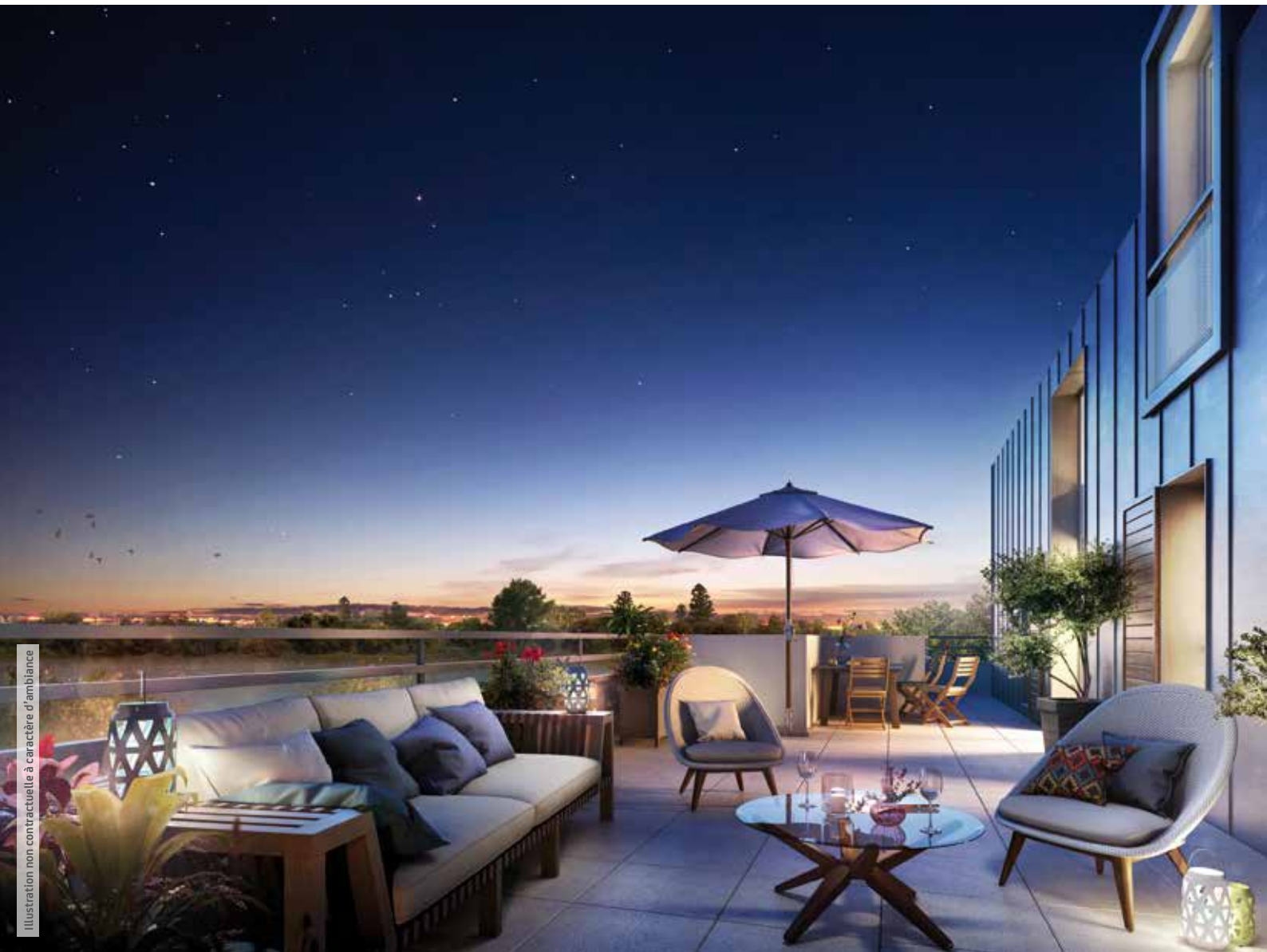
Illustration non contractuelle à caractère d'ambiance