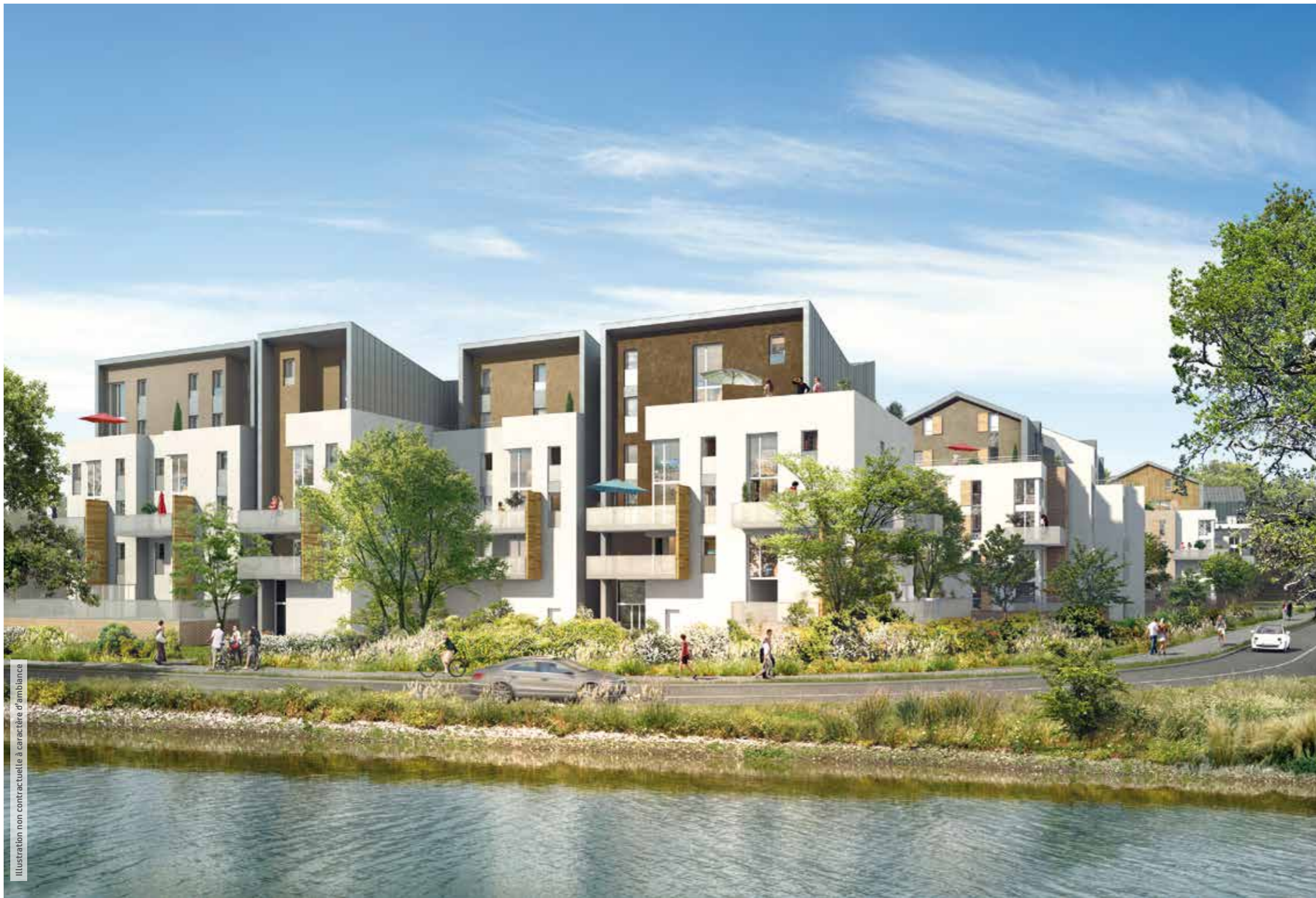
Illustration non contractuelle à caractère d'ambiance