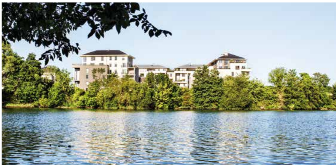
Résidence Parc en Seine livrée en 2013

Parc en Seine captive par ses lignes modernes, rythmées par un habile jeu de hauteurs et de décrochés. Elles offrent ainsi de belles percées et des vues dégagées sur les décors verdoyants, invitant à profiter d'un quotidien toujours plus ressourçant. L'architecture, étudiée avec soin, marie efficacement des matériaux de qualité s'affichant fièrement en façade. L'harmonie des teintes, oscillant entre le beige, le gris et le marron, renforce l'esprit naturel des lieux et assure une parfaite intégration de la résidence dans son environnement.