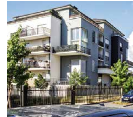
Résidence Parc en Seine livrée en 2013