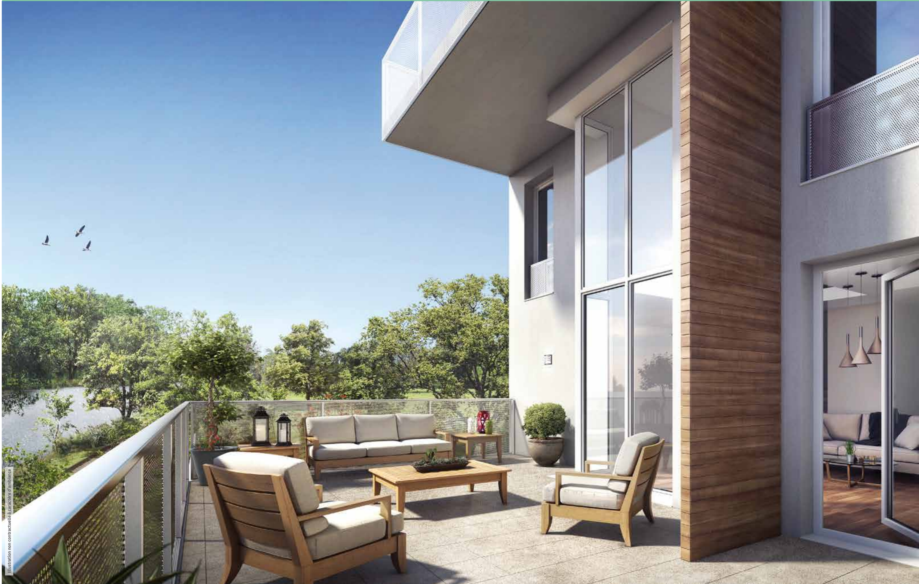
Illustration non contractuelle à caractère d'ambiance

UNE QUALITÉ DE VIE EXCEPTIONNELLE, OUVERTE SUR LA SEINE, LA NATURE ET LA VILLE