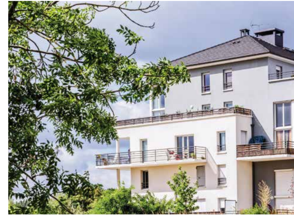
Résidence Parc en Seine livrée en 2013