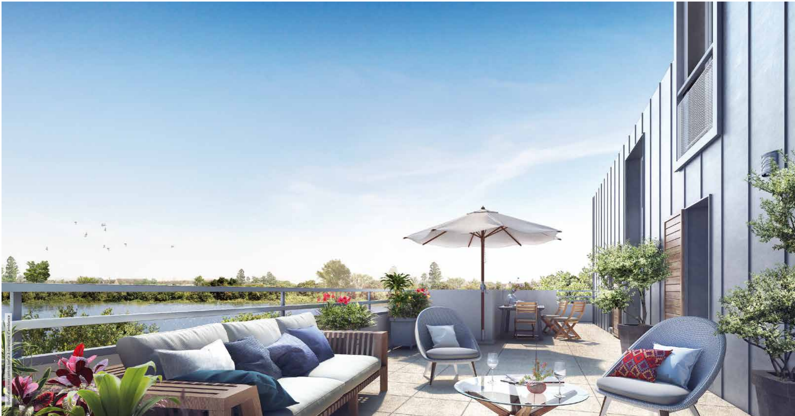
Illustration non contractuelle à caractère d'ambiance