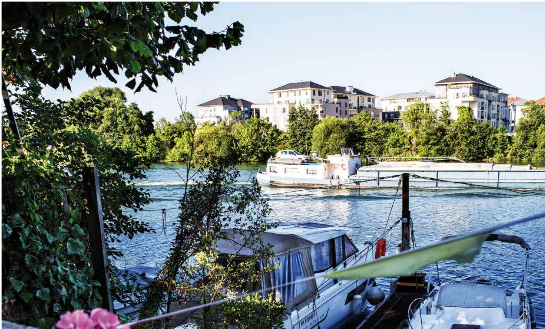
Vue de Villeneuve-le-Roi depuis la Seine

...DANS UN QUARTIER VIVANT DÉJÀ PLÉBISCITÉ PAR LES FAMILLES !