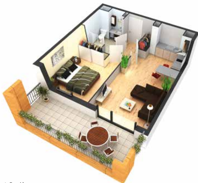
Exemple d'appartement 2 pièces

Le saviez-vous ? Votre bien peut être loué à vos ascendants. Il vous est également possible d'occuper personnellement votre logement et ainsi de vous constituer un patrimoine librement transmissible à vos enfants.