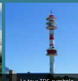
La tour TDF, symbole des télécommunications