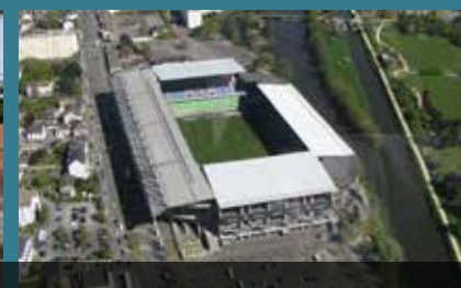
le Stade Rennais