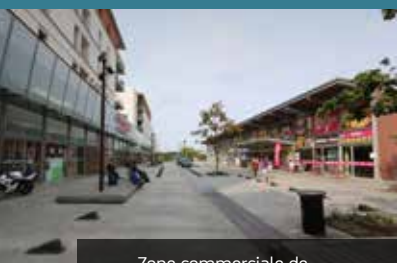
Zone commerciale de St Jacques de la Lande

2 universités et 25 écoles supérieures réparties sur plusieurs campus