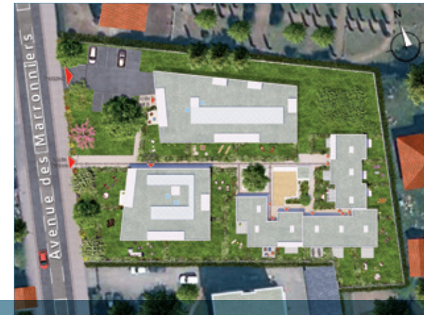
Plan de masse de l'opération