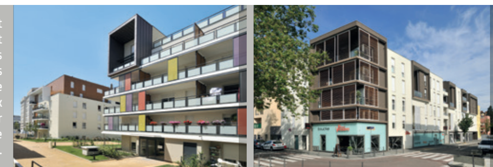
Laola - LYON 7 ème

Chez Nexity, nous savons combien les projets immobiliers soulèvent de questions et nécessitent des réponses claires, concrètes et adaptées à chaque situation. Nos équipes vous répondent et vous aident à définir votre projet. Tout au long de votre parcours, elles vous accompagnent de façon personnalisée et vous proposent de nouveaux services, de nouvelles solutions ainsi qu'un large choix d'options et de personnalisation de votre logement. Acheter un logement pour y habiter ou investir, faire gérer son patrimoine ou chercher un syndic, trouver des solutions de financement ou bien d'équipement : notre métier est d'en faire une belle vie immobilière.