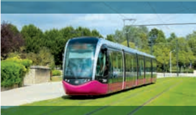
Le tramway à Dijon