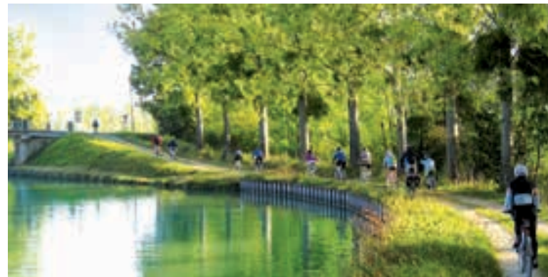
Les berges du canal de Bourgogne près de la résidence