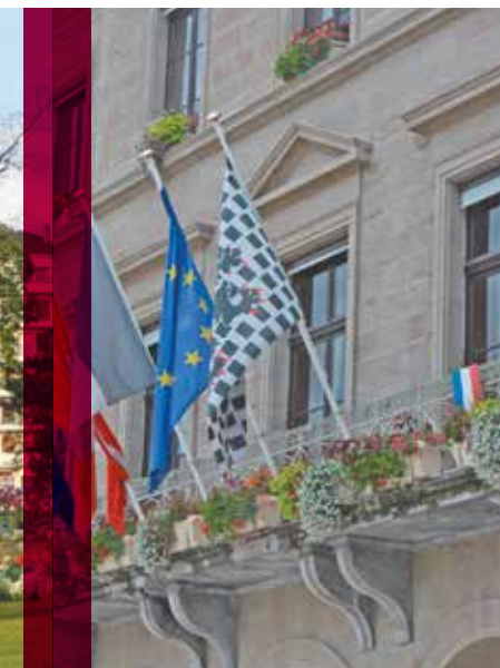
Thonon-les-Bains Hôtel de ville