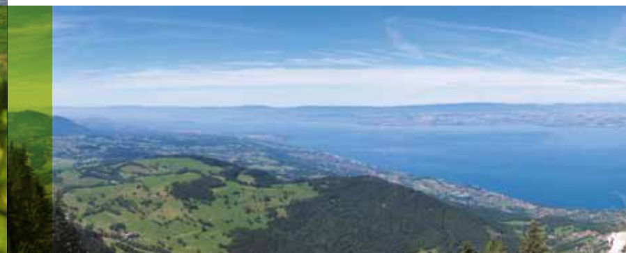
Le Lac Léman