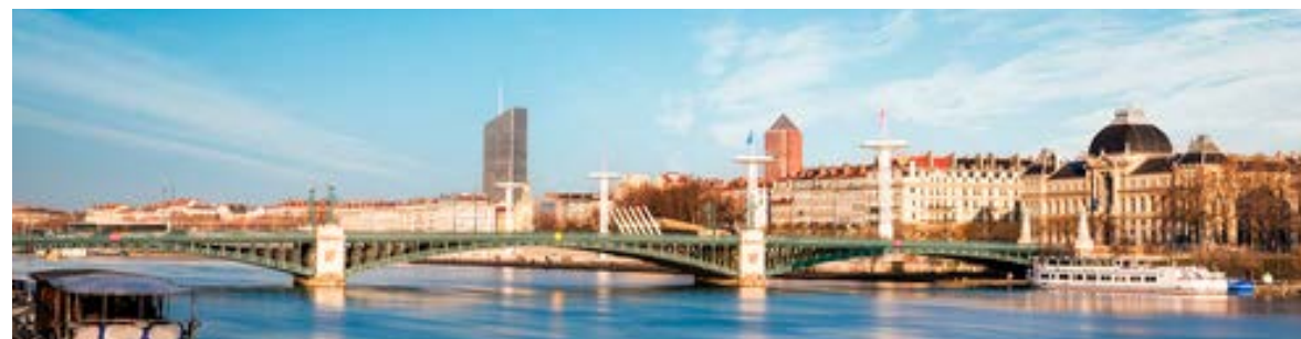
Vue de Lyon et de Part-Dieu depuis le Rhône

Pour vivre ou investir : ici, votre patrimoine a de la valeur pour longtemps !