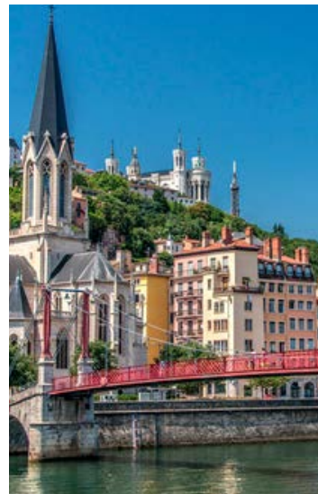
Vue du Vieux-Lyon et de Fourvière