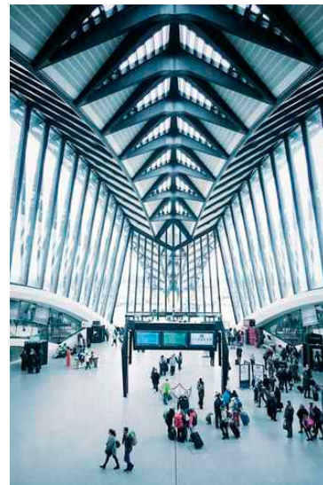
Aéroport / gare St-Exupéry