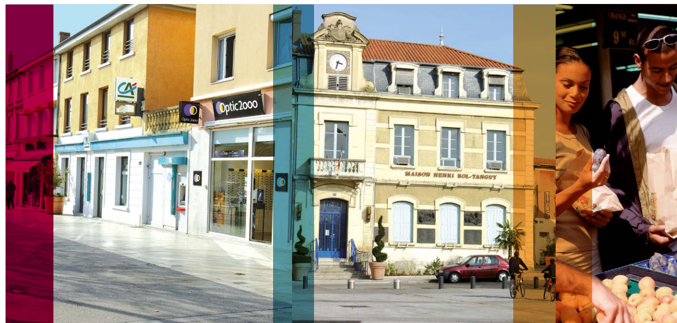
Commerces du centre-ville