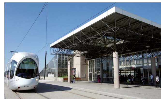
Tram T4 - Gare de Vénissieux