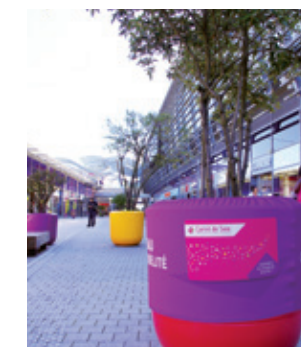
Carré de Soie