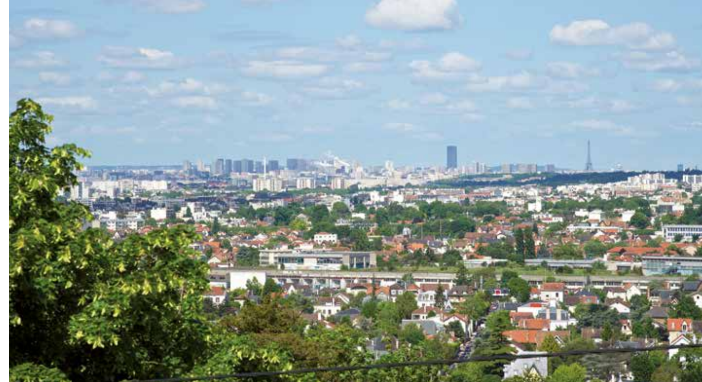
Panorama sur Paris depuis les terrasses de Chennevières-sur-Marne