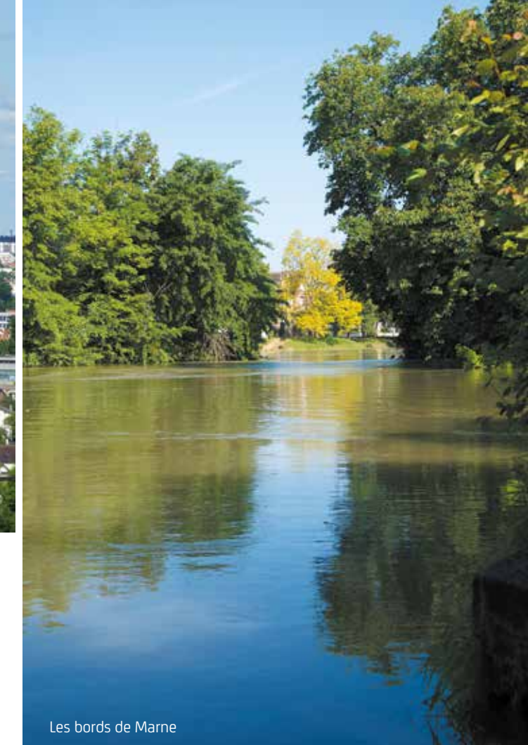
Les bords de Marne

A utrefois village, Chennevières-sur-Marne a conservé le charme authentique de ses demeures en pierre meulière, son ambiance de petit bourg et la beauté de ses décors naturels. Depuis la terrasse panoramique classée, Paris se dévoile à l'horizon tandis qu'en bords de Marne, les promenades au fil de l'eau rappellent la belle époque des guinguettes. Avec LES VILLAS DES COTEAUX , ce cadre de vie rare à 13 km de la capitale s'offre à vous.