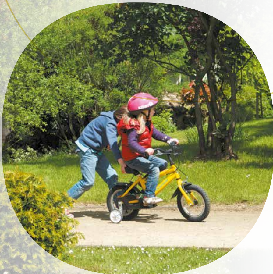
Le parc Corot