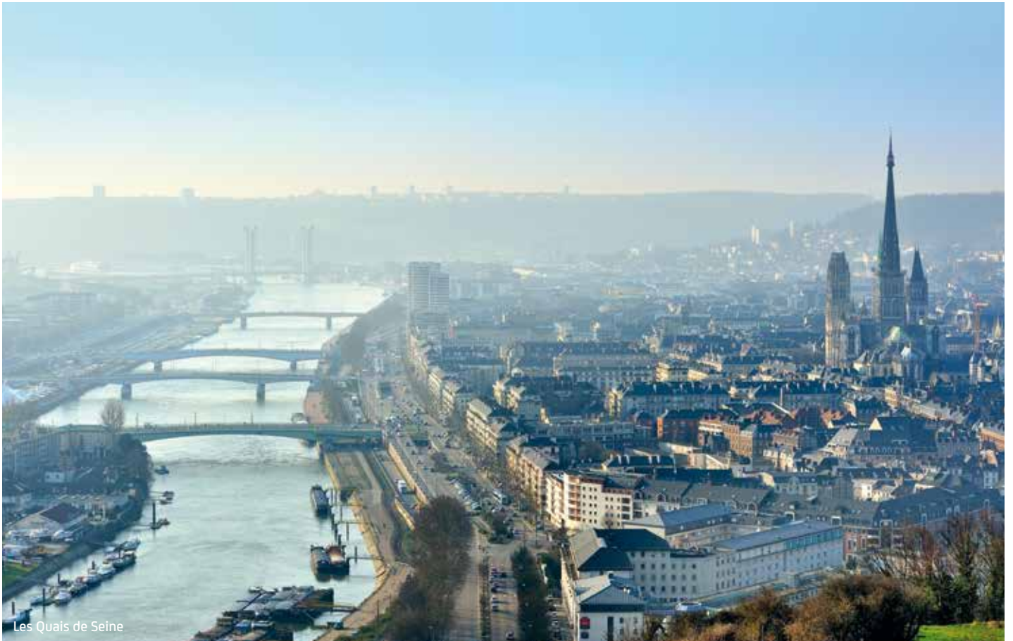
Les Quais de Seine