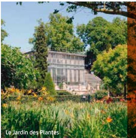
Le Jardin des Plantes