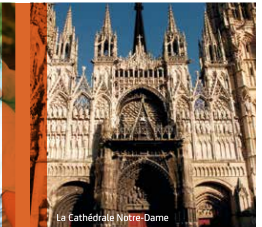
La Cathédrale Notre-Dame