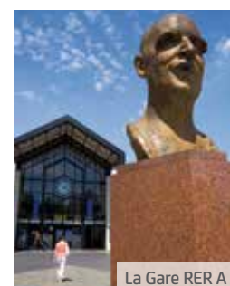
La Gare RER A

* Distance donnée à titre indicatif. ** Trajets donnés à titre indicatif. *** Projet susceptible d'évoluer.