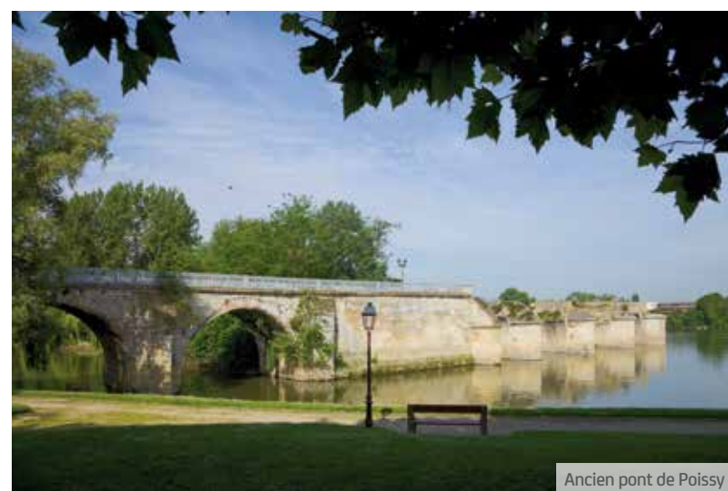
Ancien pont de Poissy