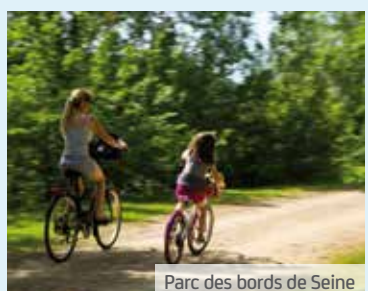
Parc des bords de Seine