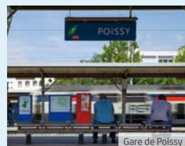
Gare de Poissy

* Source RATP. Trajet donné à titre indicatif.