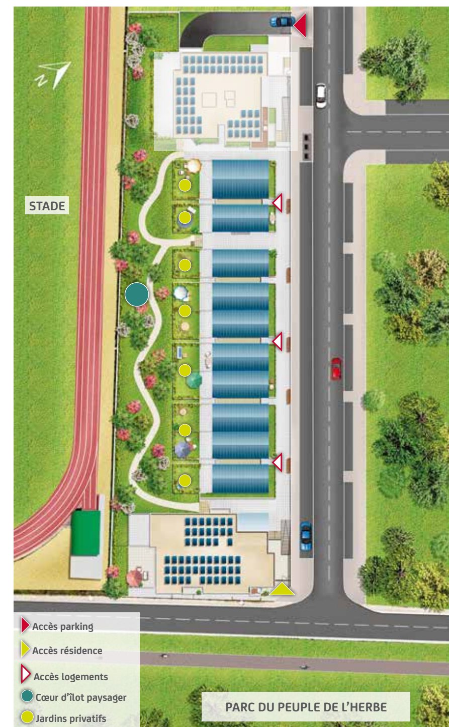
PARC DU PEUPLE DE L'HERBE

Crystal Park bénéficie d'une situation exceptionnelle au cœur du nouveau quartier Beaugard, entre verdure, équipements et accessibilité.