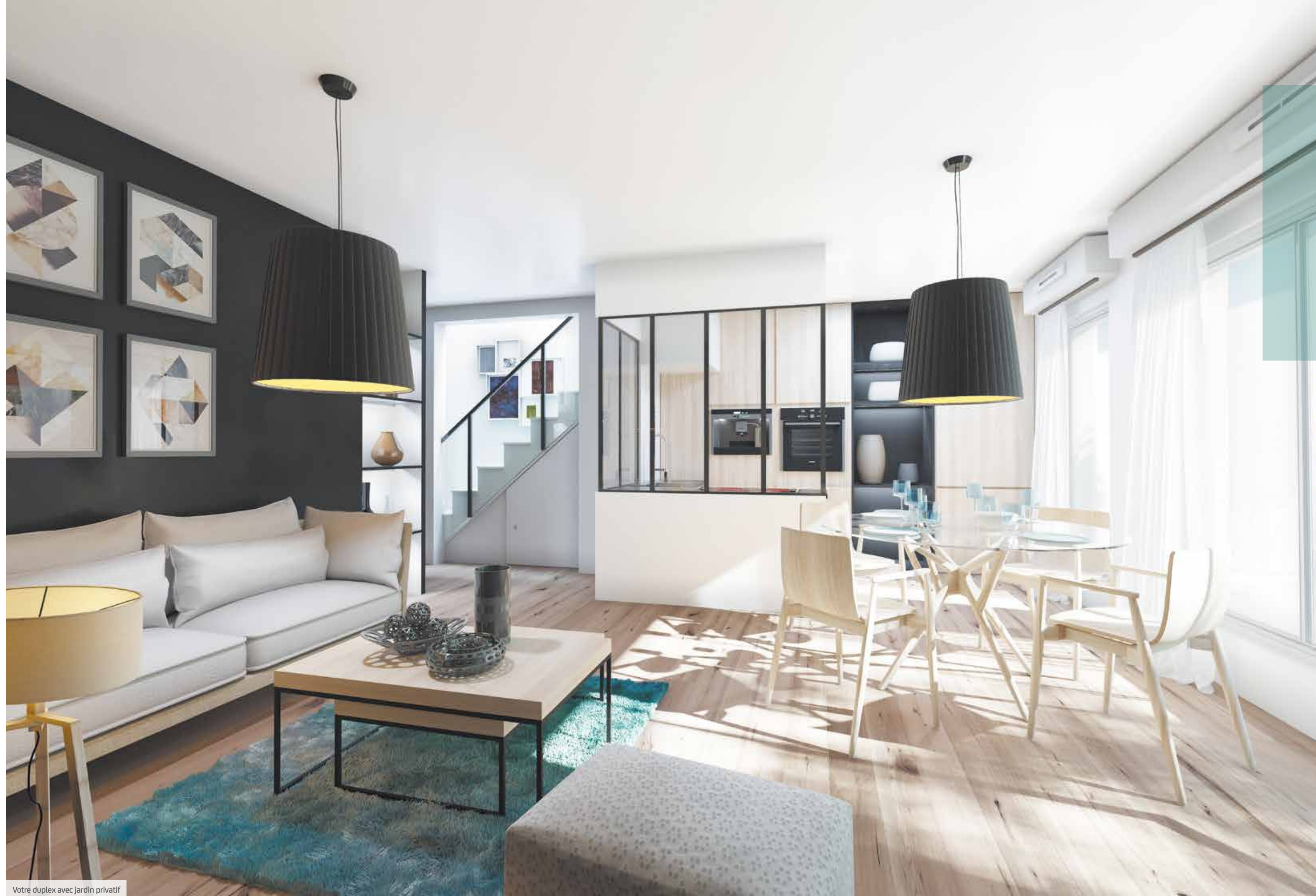
Votre duplex avec jardin privatif