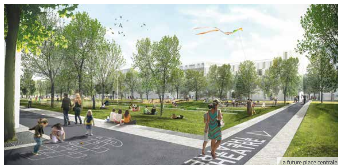
La future place centrale

« Pouvoir jouer au parc avec mon papa juste après l'école ! »