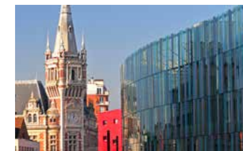
Centre commercial et cinéma