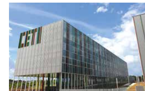
Centre Européen des Textiles Innovants