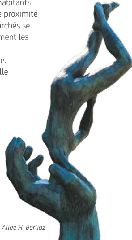
Statue Allée H. Berlioz