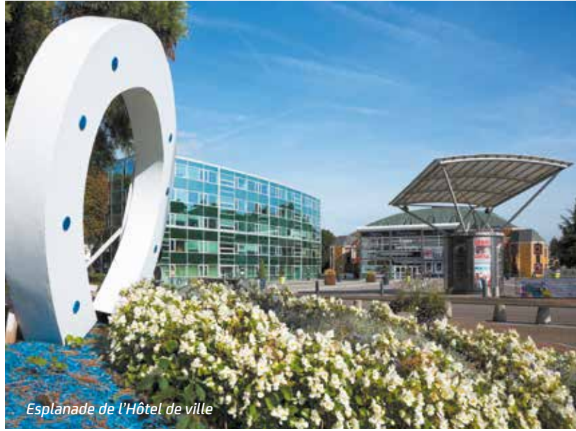
Esplanade de l'Hôtel de ville