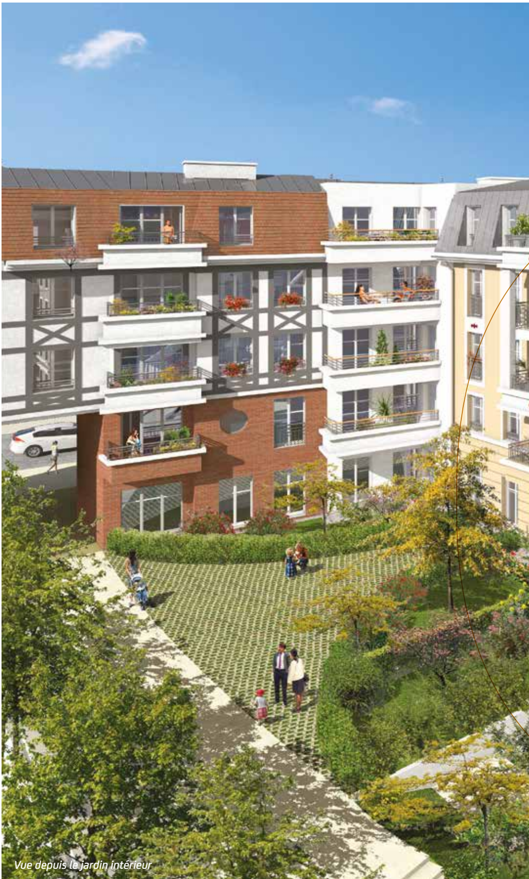
Vue depuis le jardin intérieur