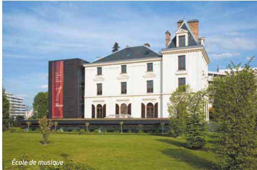
École de musique