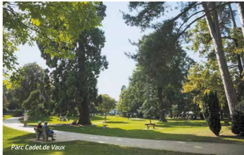
Parc Cadet de Vaux