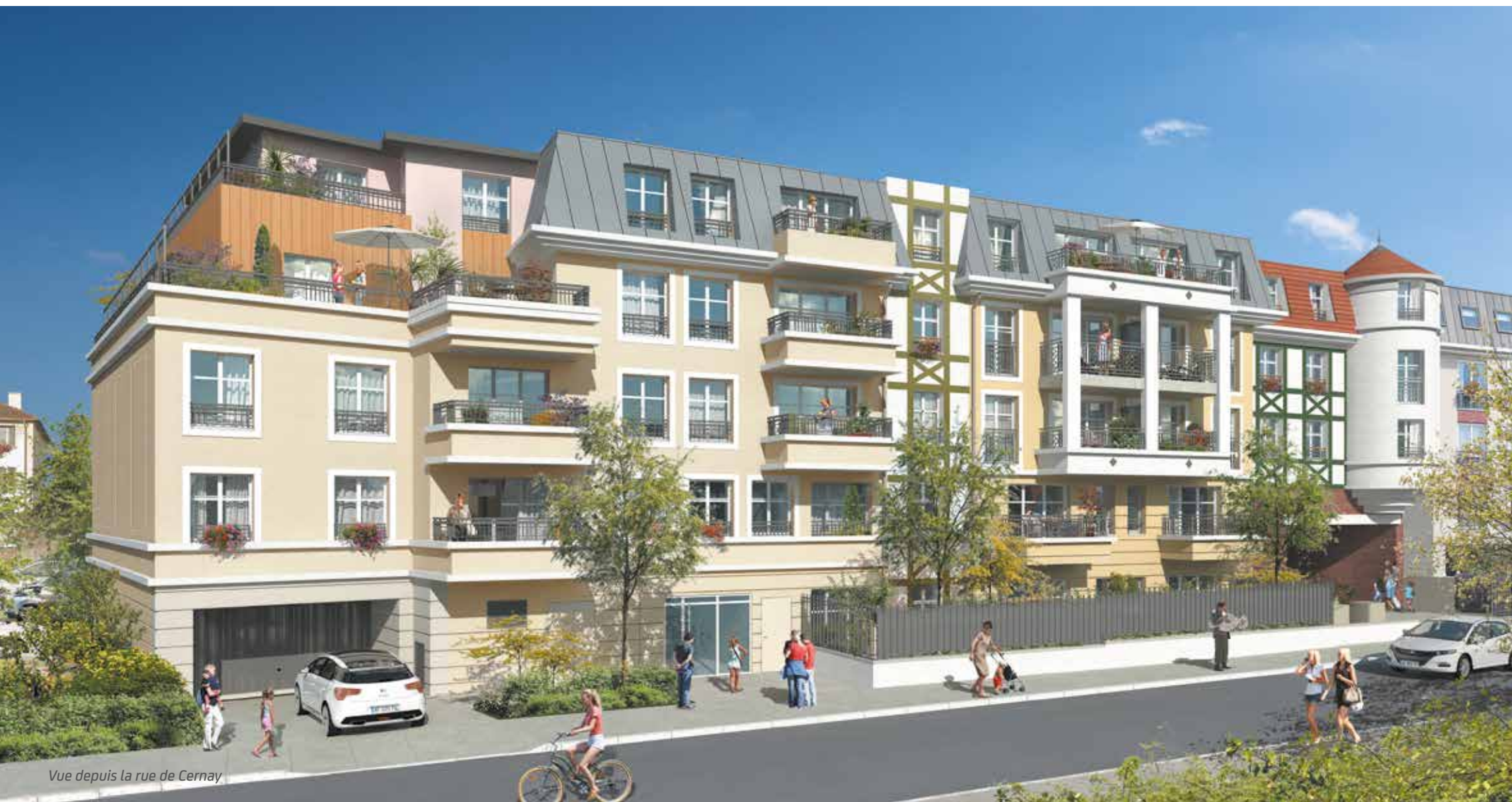
Vue depuis la rue de Cernay

HARMONIE regroupe un large choix d'appartements du studio au 5 pièces, des duplex et des maisons de 4 et 5 pièces. Les intérieurs sont idéalement prolongés par de beaux balcons, des terrasses plein ciel ou de vastes jardins privés. Ces espaces extérieurs deviennent des pièces de vie incontournables aux beaux jours pour des moments de partage, de détente et de convivialité.