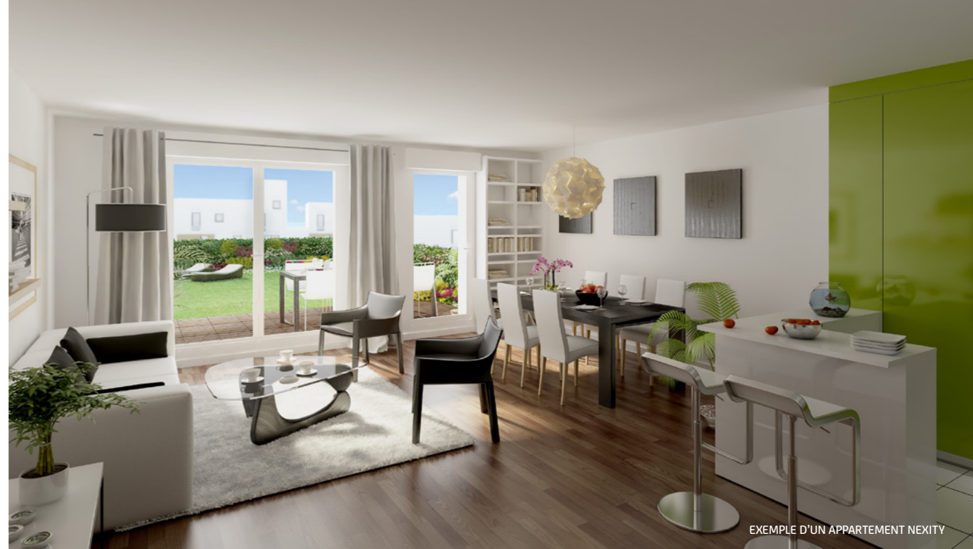
EXEMPLE D'UN APPARTEMENT NEXITY