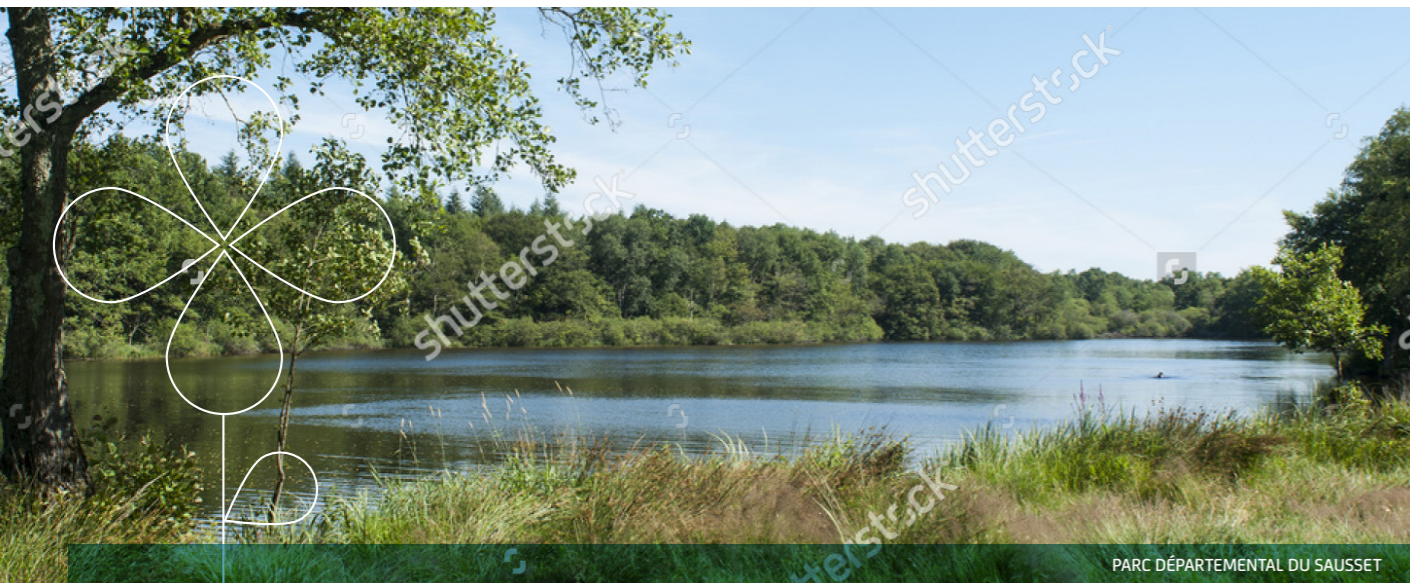
PARC DÉPARTEMENTAL DU SAUSSET