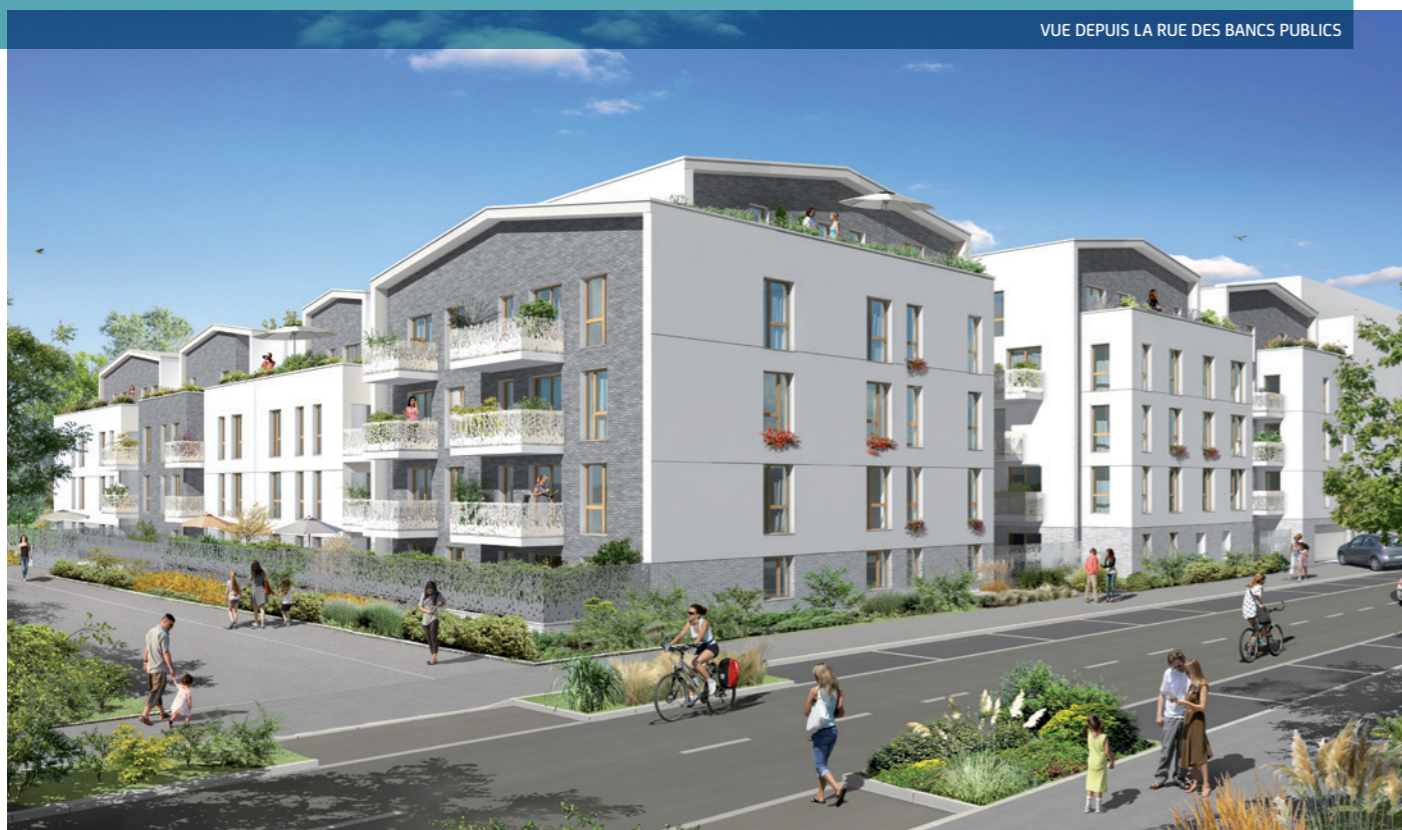
VUE DEPUIS LA RUE DES BANCS PUBLICS