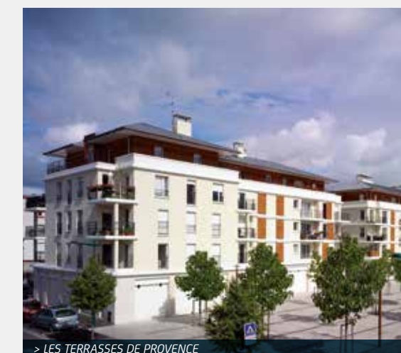
> LES TERRASSES DE PROVENCE