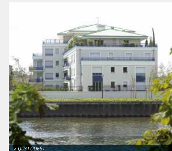
> QUAI OUEST