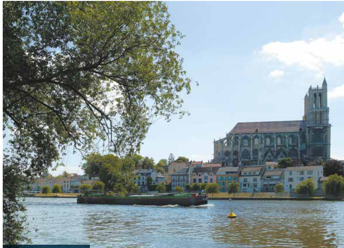
> Les bords de Seine et la Collégiale

Mantes-la-Jolie doit son nom à Henri IV, qui écrivit autrefois à Gabrielle d'Estrée : « Je suis à Mantes, ma jolie ». Des mots, qui devinrent indissociables de la ville.