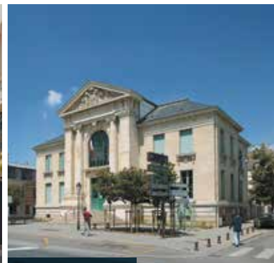
> Le Palais de Justice