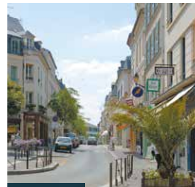
> La rue Nationale

À 50 km* de Paris, Mantes-la-Jolie est parfaitement connectée à la capitale par le Transilien. Elle profitera en plus, dès 2024 de l'arrivée du RER E qui permettra de rejoindre La Défense en 48 minutes**.