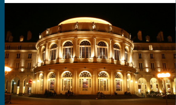
Opéra de Bretagne