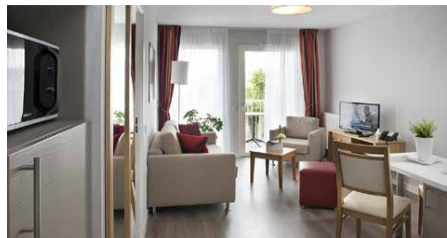
Exemple d'appartement 3 pièces