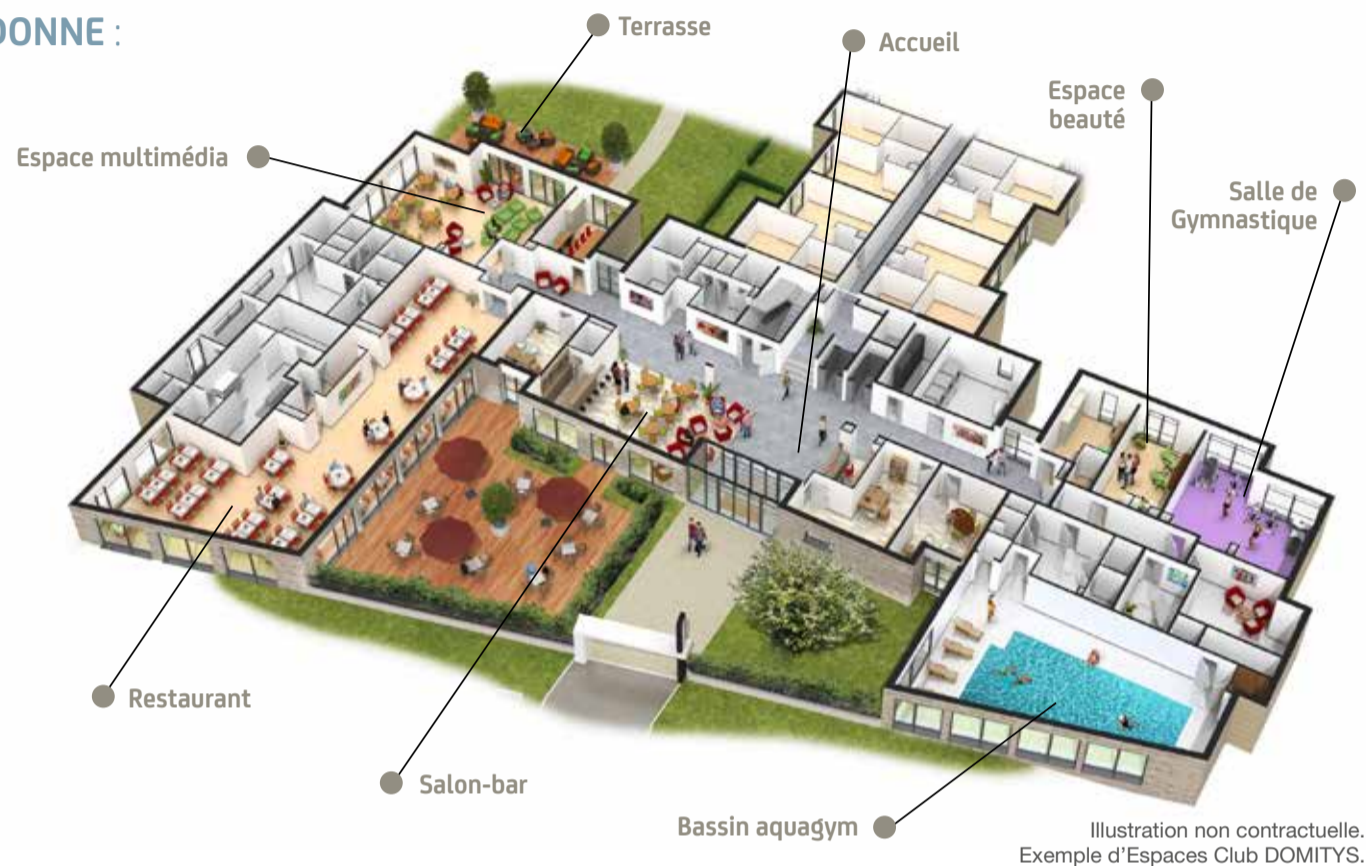
Illustration non contractuelle. Exemple d'Espaces Club DOMITYS.

Le cœur d'une Résidence DOMITYS, ce sont ses "Espaces Club", lieux de convivialité et de détente où vous pouvez passer du temps, vous divertir et échanger à votre rythme.