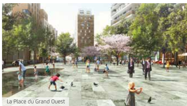
La Place du Grand Ouest

Au cœur de ce quartier emblématique, la Place du Grand Ouest plantée d'arbres devient le point d'orgue de ce projet ambitieux tant sur le plan urbain qu'humain. Ici, les liens se tissent à la terrasse des cafés, les pas ralentissent devant les vitrines des magasins, les projets prennent vie dans les associations, les rires résonnent dans les squares, les yeux brillent à la sortie du cinéma et les mains s'enlacent le long des mails arborés.