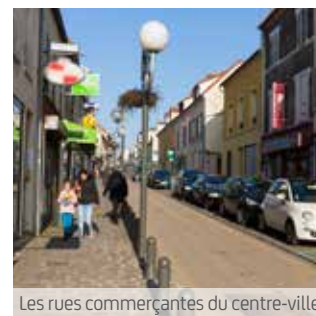
Les rues commerçantes du centre-ville