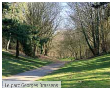
Le parc Georges Brassens