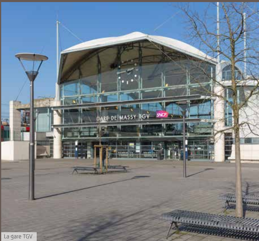
La gare TGV