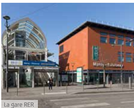
La gare RER

Ce quartier devient le symbole d'une nouvelle conception de la vie citadine... une vie dans laquelle les loisirs, la convivialité, le confort, le travail, la détente, la sécurité et la nature se conjuguent au quotidien pour tous.