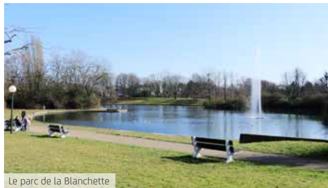
Le parc de la Blanchette

Car Massy est une commune à la fois moderne et conviviale. Moderne par sa capacité à offrir à ses habitants un quotidien de qualité grâce à ses écoles, de la maternelle au lycée, ses nombreux commerces et ses quartiers précurseurs en terme d'innovation et de protection de l'environnement. Conviviale, la ville l'est sans conteste en proposant une offre culturelle et des infrastructures sportives variées, des parcs, des restaurants et des voies douces où circuler en toute tranquillité. Idéalement située en bordure du parc naturel de la Haute Vallée de Chevreuse, la ville a toujours pris soin de préserver son patrimoine naturel historique. Elle invite dorénavant la nature au cœur de la cité pour parfaire chaque jour le bien-être des Massicois.