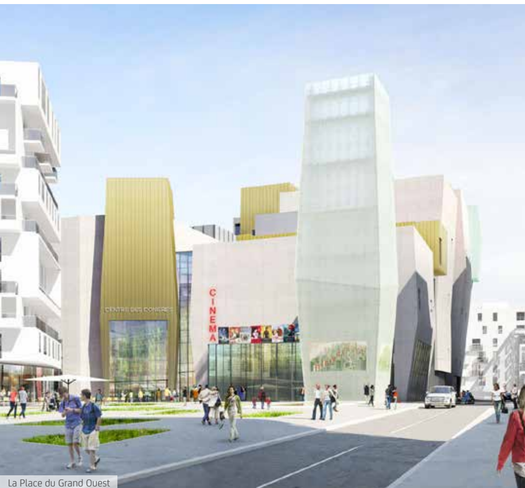
La Place du Grand Ouest

Pour les habitants du quartier, les voyageurs ou les salariés, la Place du Grand Ouest devient le lieu où la vie citadine s'épanouit pleinement et s'envisage connectée au monde et aux autres.