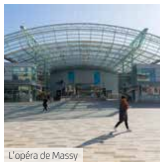
L'opéra de Massy