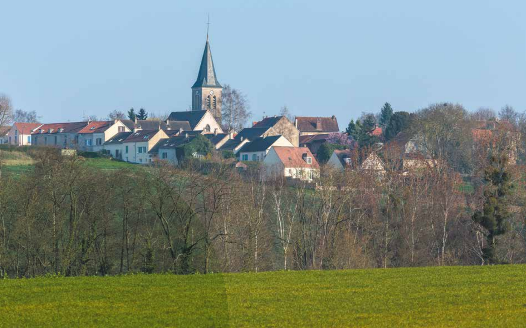
| Le charme de Bussy-Saint-Georges