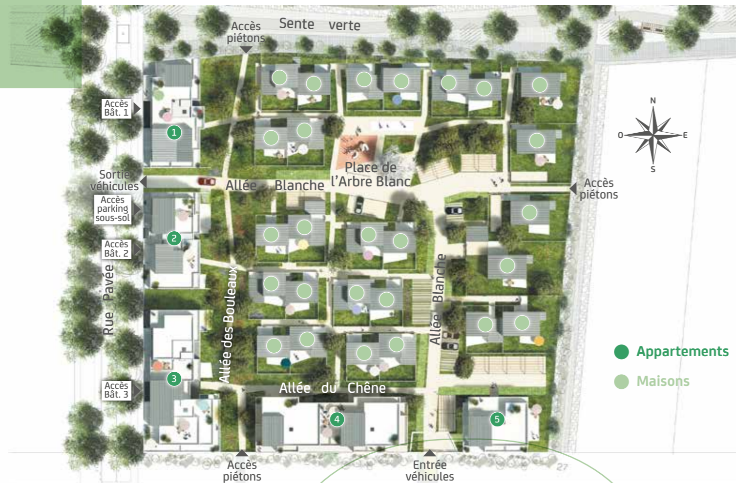
Plan masse de principe susceptible d'évolution