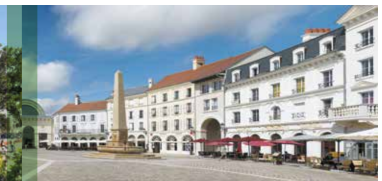
SERRIS / 77