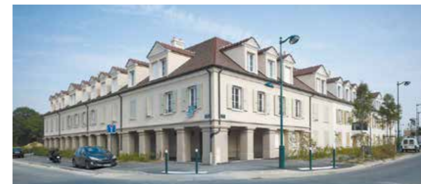
BAILLY-ROMAINVILLIERS / 77