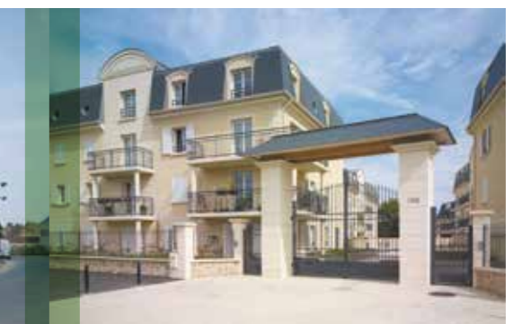
DAMMARIÉ-LES-LYS / 77