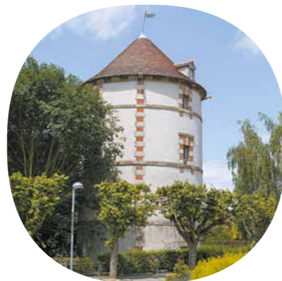
| Le pigeonnier

Blottie entre Marne et forêt, Bussy-Saint-Georges, était autrefois une petite bourgade agricole. Son intégration à la ville nouvelle de Marne-la-Vallée en a fait une commune vivante, prisée pour sa proximité des grands pôles d'emplois dont Disneyland-Paris®. La ville dispose aujourd'hui d'une gare RER et profite d'un accès facilité par l'A4. Elle séduit les familles par ses infrastructures scolaires, ses commerces et ses équipements sportifs et culturels modernes.