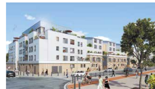
MONTÉVRAIN / 77