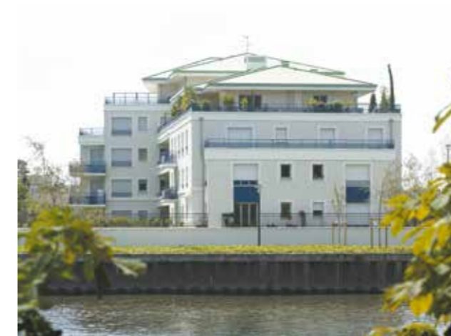
MANTES-LA-JOLIE / 78