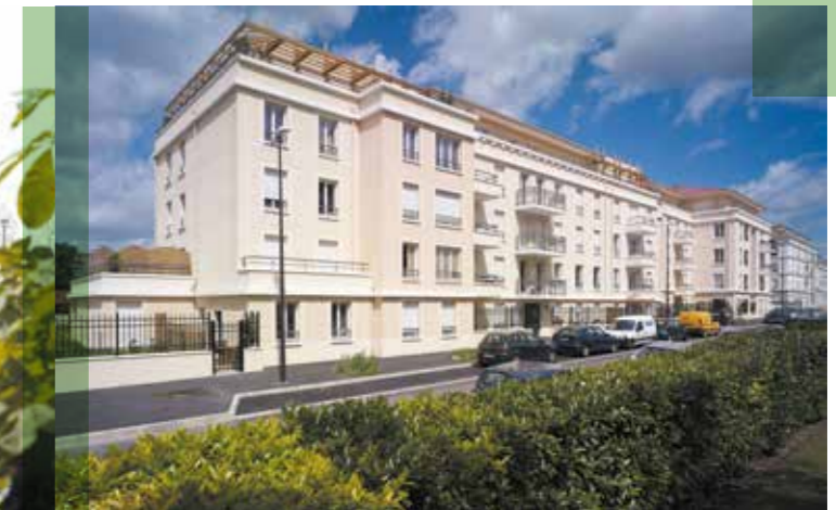
DEUIL-LA-BARRE / 95