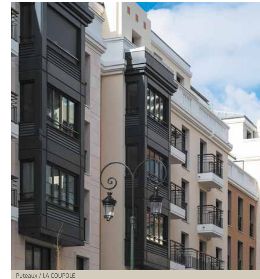
Puteaux / LA COUPOLE