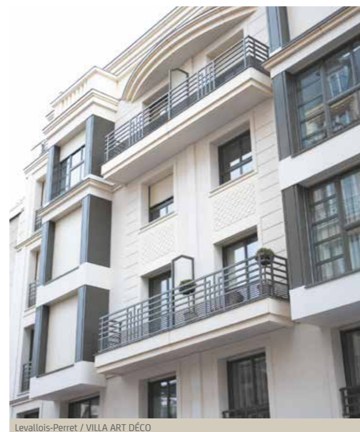
Levallois-Perret / VILLA ART DÉCO