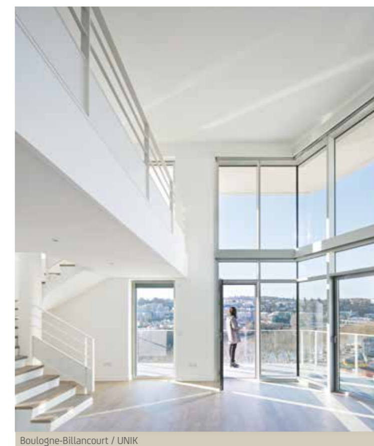
Boulogne-Billancourt / UNIK