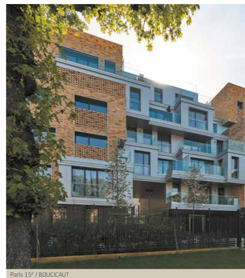
Paris 15 e / BOUCICAUD