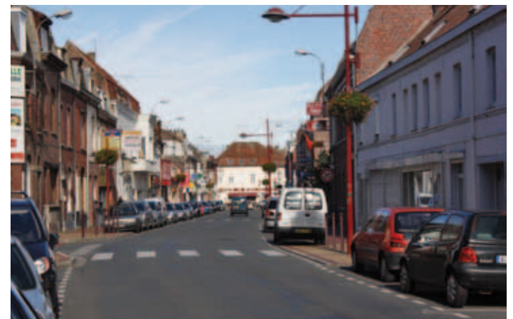
Rue Jules Guesde, très commerçante, à proximité immédiate de la résidence Les Hauts de Lys