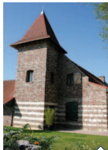
Ferme du Gauquier

La résidence Les Hauts de Lys dépend du quartier Jules Guesde situé en grande partie de part et d'autre de l'ancienne ligne de chemin de fer menant de Tourcoing à Somain, laissant place à la Coulée Verte. Les opportunités de respirer, flâner, se balader, faire du vélo ou courir ne manquent pas. Les amateurs de promenades trouveront aussi leur bonheur au parc Jean Ferrat, au bord de l'étang et du parc Maréchal attenant ou encore au nouveau parc écologique Boussebart. Un lieu pédagogique situé entre les rues du Progrès et Lebas, où vous pouvez observer des espèces d'oiseaux et d'amphibiens.