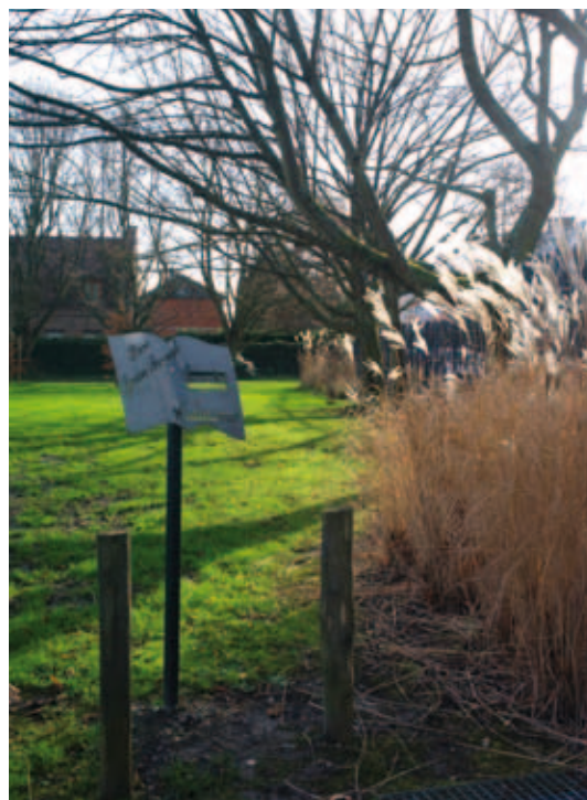
Parc Jean Ferrat