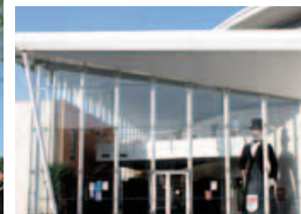
Centre culturel Agora