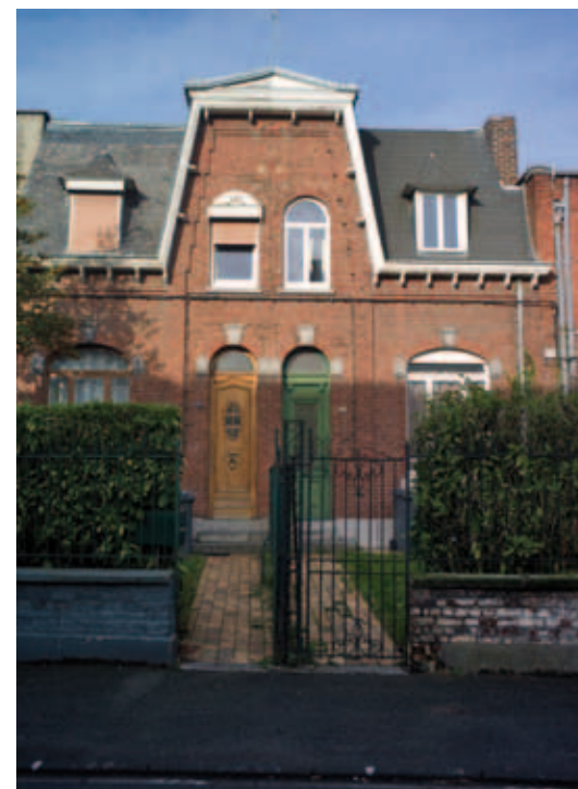
Elegante maisons du centre