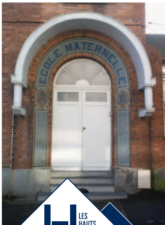
Ecole maternelle Anatole France