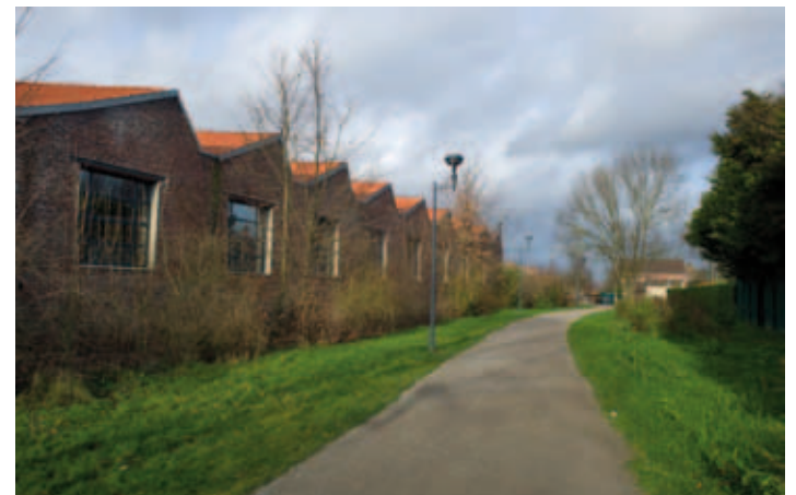
La Coulée Verte