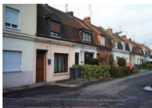
Charme des rues adjacentes, des rangées Backaert et Leroy